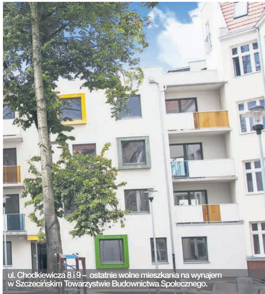
ul. Chodkiewicza 8 i 9 – ostatnie wolne mieszkania na wynajem w Szczecińskim Towarzystwie Budownictwa Społecznego.