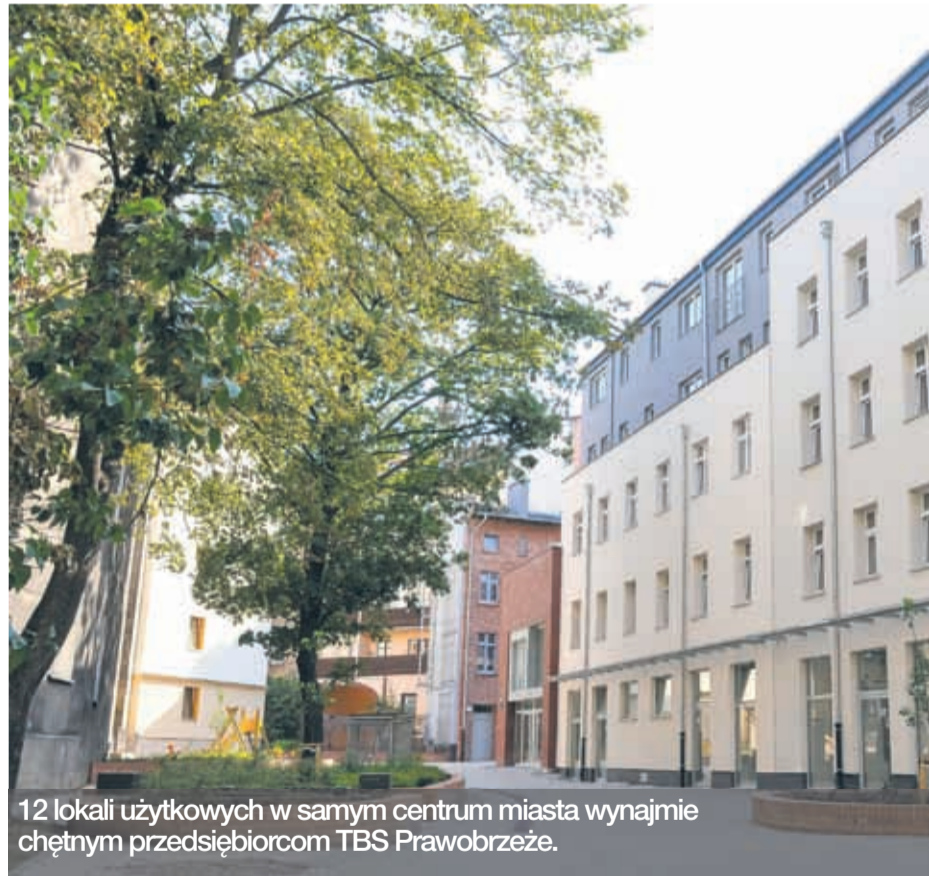
12 lokali użytkowych w samym centrum miasta wynajmie chętnym przedsiębiorcom TBS Prawobrzeże.

12 lokali użytkowych w samym centrum miasta wynajmie chętnym przedsiębiorcom TBS Prawobrzeże. Oferta dotyczy lokali położonych w obrębie zmodernizowanego i kompleksowo wyremontowanego kwartału w sąsiedztwie Parku Gen. Andersa, nieopodal placu Zgody i al. Wojska Polskiego.