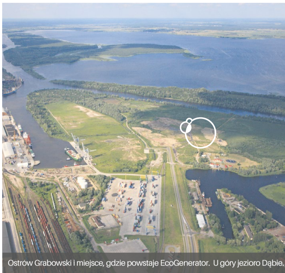
Ostrów Grabowski i miejsce, gdzie powstaje EcoGenerator. U góry jezioro Dąbie.

Mniej odpadów to mniejsze koszty transportu, zbierania i utylizacji. Np. używając toreb wielokrotnego użytku albo kupując napoje w szklanych butelkach zwrotnych redukujeś ilość odpadów plastikowych. Zamiast wyrzucać niepotrzebne ubrania, meble czy inne przedmioty, możesz je przekazać znajomym bądź organizacjom charytatywnym.