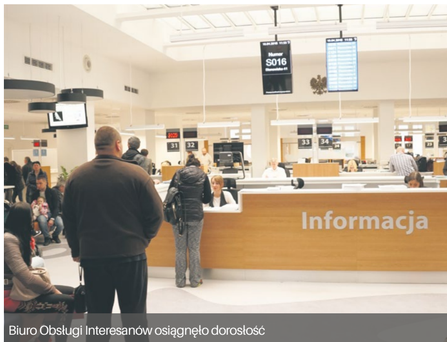
Biuro Obsługi Interesantów osiągnęło dorosłość

W ostatnich latach działalności BOI wprowadzono elektroniczny system