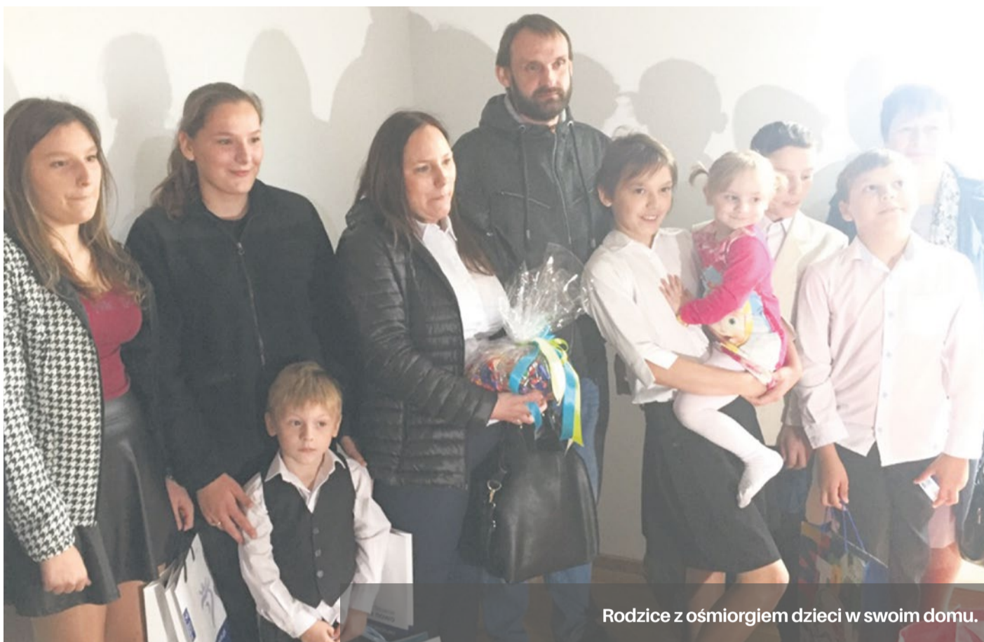
Rodzice z ośmiorgiem dzieci w swoim domu.

Z kolei podstawowym założeniem elementu tego programu jakim jest „Dom Dużej Rodziny” jest wsparcie rodzin niezamożnych i wielodzietnych w poprawie warunków mieszkaniowych, zarówno w zakresie poprawy standardu technicznego wynajmowa-