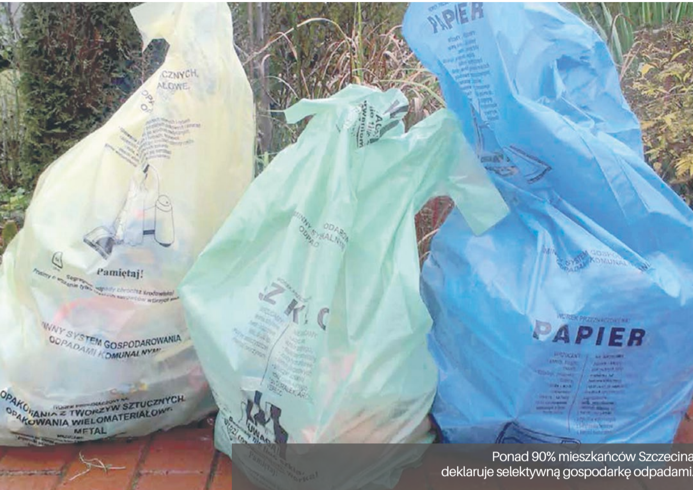
Ponad 90% mieszkańców Szczecina deklaruje selektywną gospodarkę odpadami.

przeznaczone na pozostałe odpady komunalne.