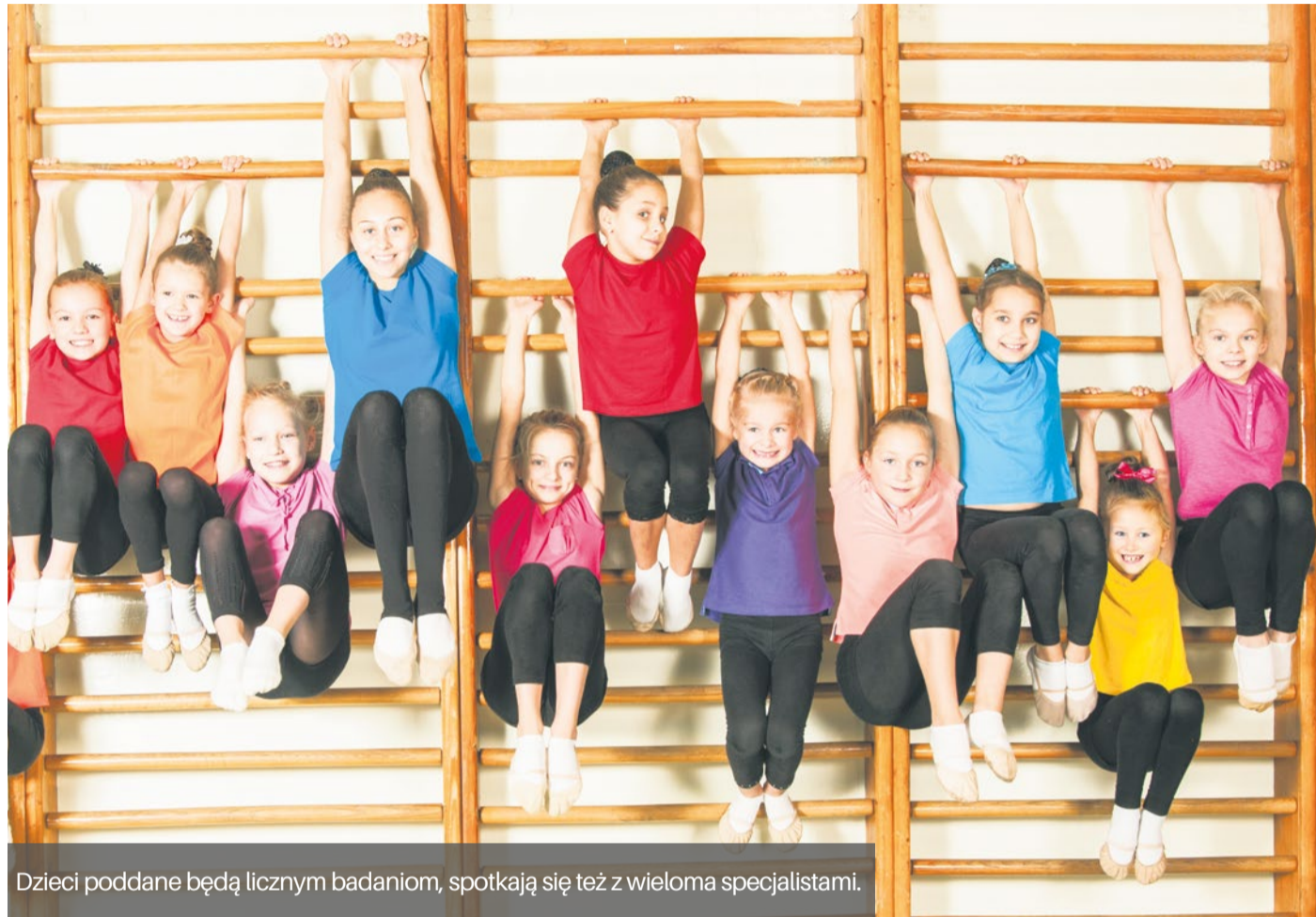
Dzieci poddane będą licznym badaniom, spotkają się też z wieloma specjalistami.

Szczecin przystępuje do walki z nadwagą i otyłością wśród najmłodszych mieszkańców to jeden z punktów Drugiego Porozumienia dla Szczecina.