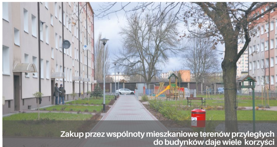
Zakup przez wspólnoty mieszkaniowe terenów przyległych do budynków daje wiele korzyści

Wspólnoty mieszkaniowe mogą ubiegać się o wykup działek okalających ich budynki. Tereny można nabyć za 5 procent wartości.