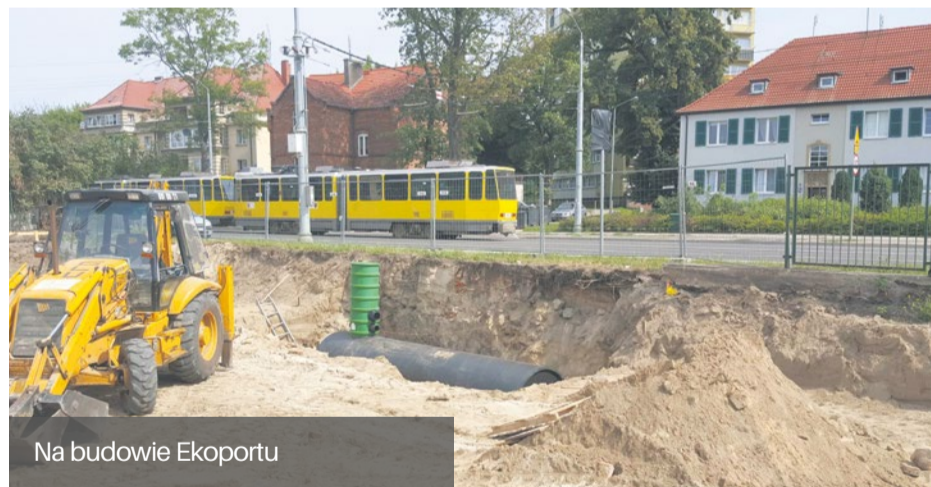
Na budowie Ekoportu

Wykonawcy wchodzą w kolejny etap budowy najnowocześniejszego szczecińskiego Ekoportu. Prace ziemne są już na ukończeniu.