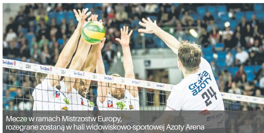
Mecze w ramach Mistrzostw Europy, rozegrane zostaną w hali widowiskowo-sportowej Azoty Arena

Mecze, które odbędą się w ramach Mistrzostw Europy, rozegrane zostaną w hali widowiskowo-sportowej Azoty Arena przy ul. Szafera. Losowanie grup turniejowych na przyszłoroczne Mistrzostwa, odbędzie się już 15 listopada w Krakowie.