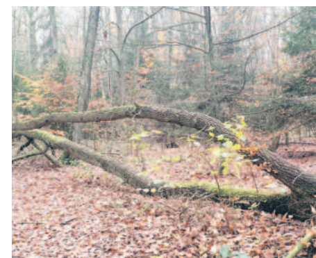
Uszkodzone drzewa w Puszczy Wkrzańskiej