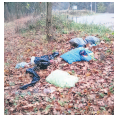
Dziki wysypisko śmieci

Niestety nadal bardzo często zgłaszane są dzikie wysypiska śmieci, ostatnio firma sprzątająca oczyściła m. in. teren zielony przy ul. Goleniowskiej.