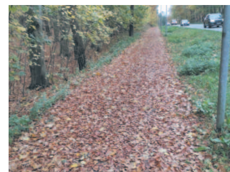
Ścieżka rowerowa przykryta liśćmi

Z aplikacji Alert Szczecin 2.0 można korzystać w urządzeniu mobilnym (telefon, tablet) opartym na Androidzie, systemie iOS czy Windows Phone. Wystarczy mieć wgraną aplikację oraz dostęp do Internetu. Można również wykorzystać do tego komputer stacjonarny. Później już wszystko jest bardzo proste. Wchodzimy do aplikacji lub na stronę, wypełniamy podstawowe informacje, opisujemy problem i wysyłamy do Urzędu Miasta.