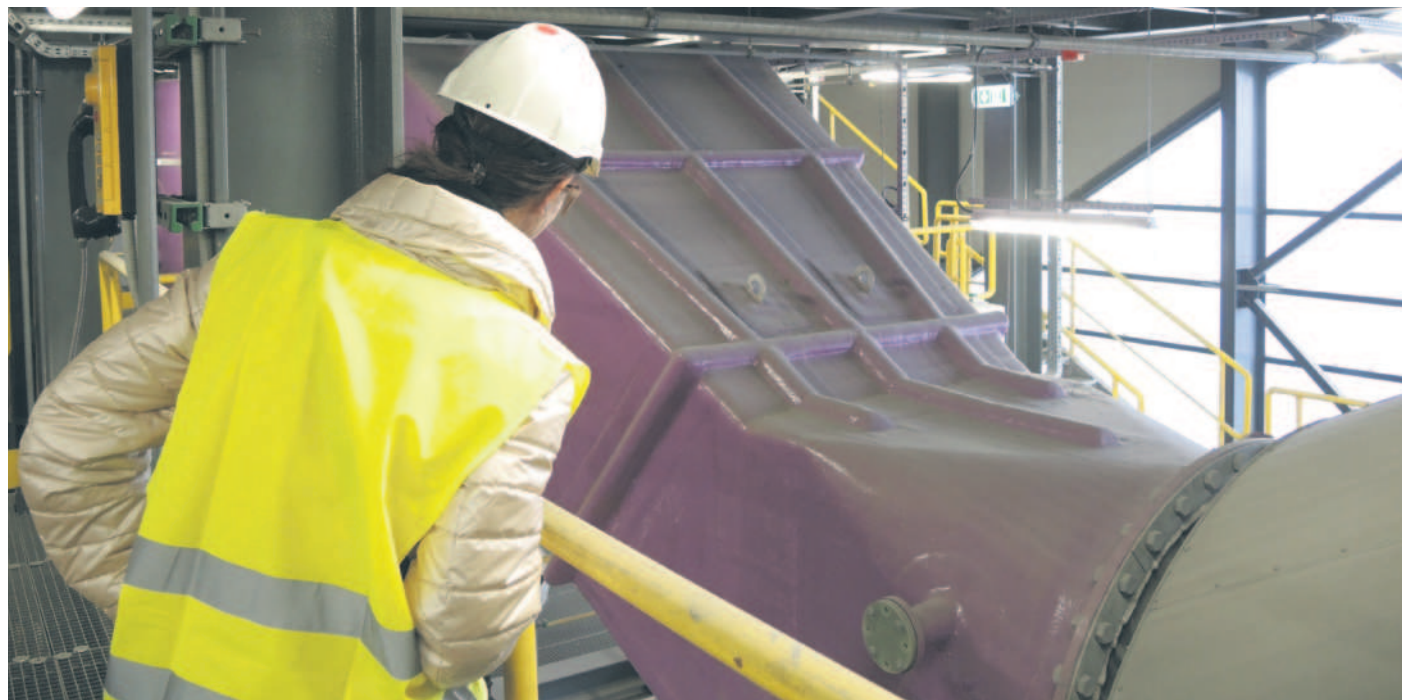
Filetowy kolor instalacji oznacza, że to tu odbywa się tzw. mokre oczyszczanie spalin.

mokra technologia oczyszczania spalin należy obecnie do najskuteczniejszych. Spaliny są pozbawione szkodliwych gazów i pyłów w takim stopniu, że środowisku i ludziom zupełnie nic nie zagraża. Ścieki technologiczne, które powstają podczas oczyszczania spalin, trafiają natomiast do własnej oczyszczalni ścieków przemysłowych, w którą wyposażony jest EcoGenerator. Poza tym są regularnie badane przez zewnętrzne akredytowane laboratorium.