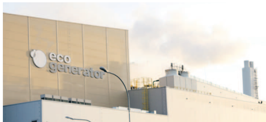
Opary z kominu EcoGeneratora widać tylko wtedy, kiedy są określone warunki atmosferyczne na poziomie wylotu.

Wartości emitowanych z EcoGeneratora do środowiska substancji nie przekraczają dopuszczalnych restrykcyjnych norm zarówno polskich jak i unijnych, co więcej, instalacje spełniają je z dużym zapasem. Dlaczego? Bo zastosowana w EcoGeneratorze tzw.