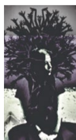
2. ARCHIE (Warszawa)

Pięcioosobowy zespół z Krakowa, założony w 2015 roku, inspirowany się klasyką brytyjskiego rocka lat 60. oraz nurtem britpopowym.