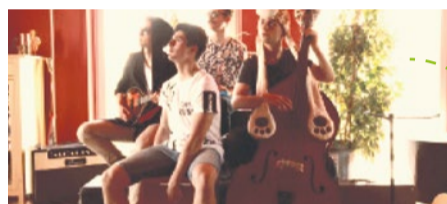
3. BLUNRAZOR (Jaworzno)

Słuchając ich muzyki dotrzesz do źródła - fale dźwięków przenikających ciało, hipnotyczność fraz i rytmów, pejzaże skąpane w kolażach brzmień, magii i tajemnicy...". Art rock