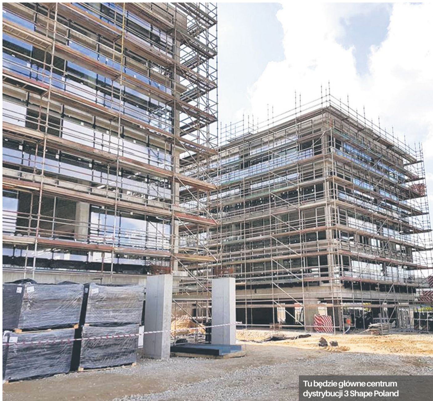
Tu będzie główne centrum dystrybucji 3 Shape Poland