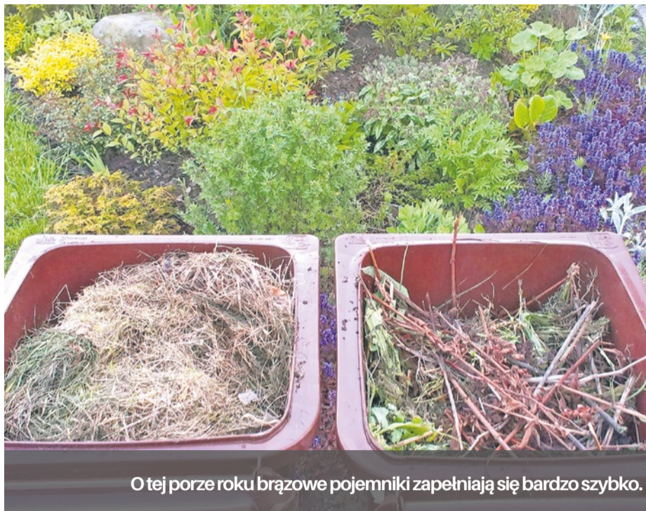
O tej porze roku brązowe pojemniki zapełniają się bardzo szybko.