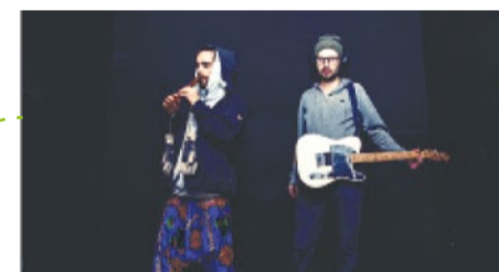
9. SMOKING BARRELZ (Kraków)

Siostry Łotry czyli polska piosenka humanistyczna Humanistyczna, bo szczerą, aktualną, publicystyczną. Siostry Łotry w sposób lekki, często żartobliwy poruszają tematy, które aż proszą się o komentarz.