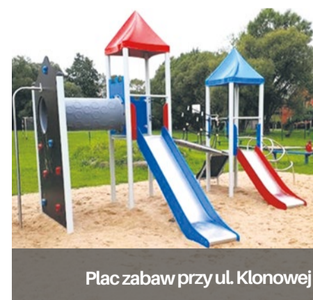
Plac zabaw przy ul. Klonowej