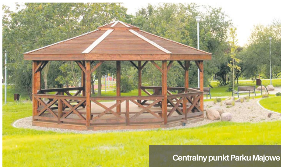
Centralny punkt Parku Majowe