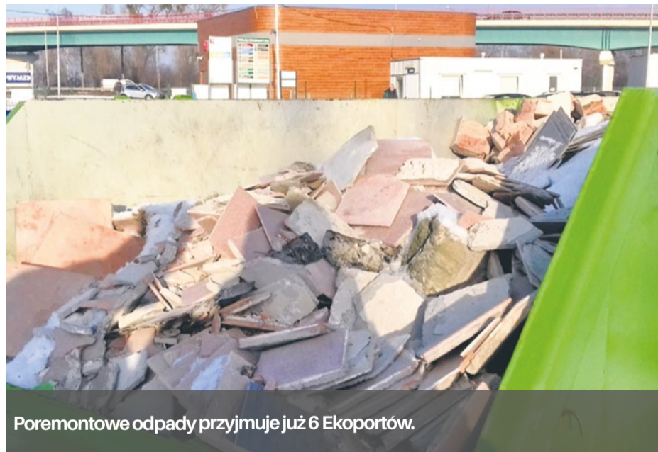
Poremontowe odpady przyjmuje już 6 Ekoportów.

Jesień sprzyja także remontom. Powstaje zatem dużo odpadów budowlanych.