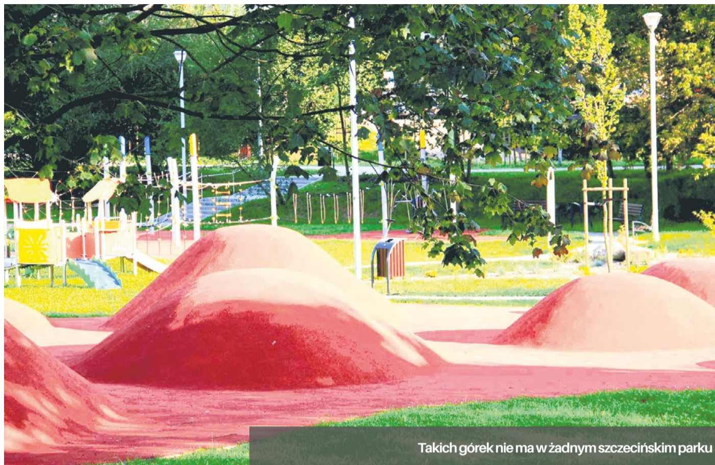
Takich gór nie ma w żadnym szczecińskim parku

To już kolejne inwestycje, które wzbogacają miasto o zielone tereny rekreacyjne.