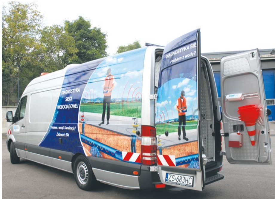
Nowy samochód do badania sieci wodociągowej i precyzyjnego lokalizowania awarii.

Najważniejszym elementem jego wyposażenia jest nowoczesny sprzęt