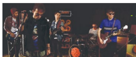
1. APPLE FIELDS (Kraków)

Pięcioosobowy zespół z Krakowa, założony w 2015 roku, inspirowany się klasyką brytyjskiego rocka lat 60. oraz nurtem britpopowym.