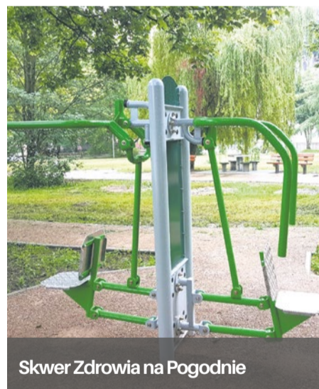
Skwer Zdrowia na Pogodnie