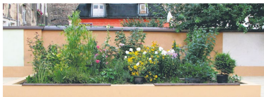
Nowe podwórko przy ul. Bł. Królowej Jadwigi 3