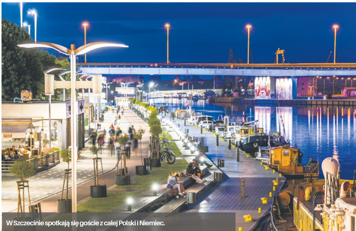
W Szczecinie spotkają się goście z całej Polski i Niemiec.

Giełda Kooperacyjna dla przedsiębiorców „Partnerschaft und Business” adresowana jest głównie do przedsiębiorców działających zarówno na rynku lokalnym, krajowym, jak i zagranicznym w branżach IT, OZE i w logistyce. Każdy przedsiębiorca będzie miał możliwość porozmawiać z partnerami z Polski lub Niemiec, także z ekspertami, przedstawicielami administracji publicznej, jak i organizacji wspierających rozwój przedsiębiorczości w obu krajach. Strategicznym partnerem tegorocznej giełdy kooperacyjnej jest Izba Prze-