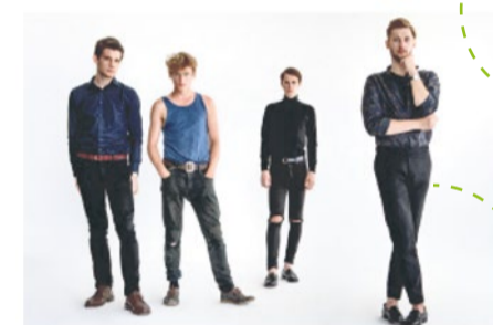
5. NOŻE (Warszawa)

Pisze, tworzy i gra razem z przyjaciółmi. Inspirują się brytyjską muzyką gitarową, oraz islandzkimi kompozycjami.