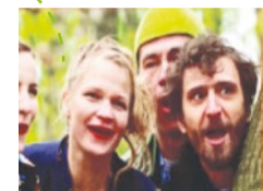
8. SIOSTRY ŁOTRY (Warszawa/Lublin/Toruń)

Jaworznicko-krakowskie trio, składające się z trójki przyjaciół. Tworzą muzykę raczej smutną, ale niekiedy taneczną. Niby romantycy, ale zawsze trochę niepoważni.