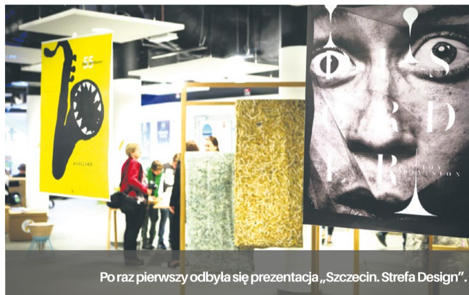
Po raz pierwszy odbyła się prezentacja „Szczecin. Strefa Design”.