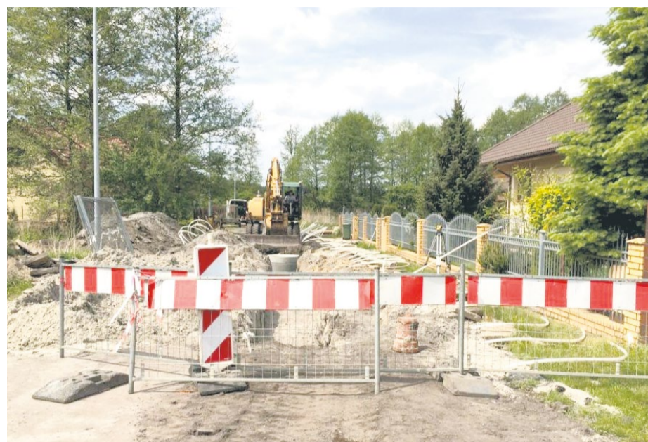
Prace na ul. P. Robiena

Szczecin jest skanalizowany niemal w całości. ZWiK systematycznie buduje nowe instalacje w miejscach pozbawionych sieci sanitarnej. Spółka zachęca mieszkańców do podłączania się do kanalizacji.