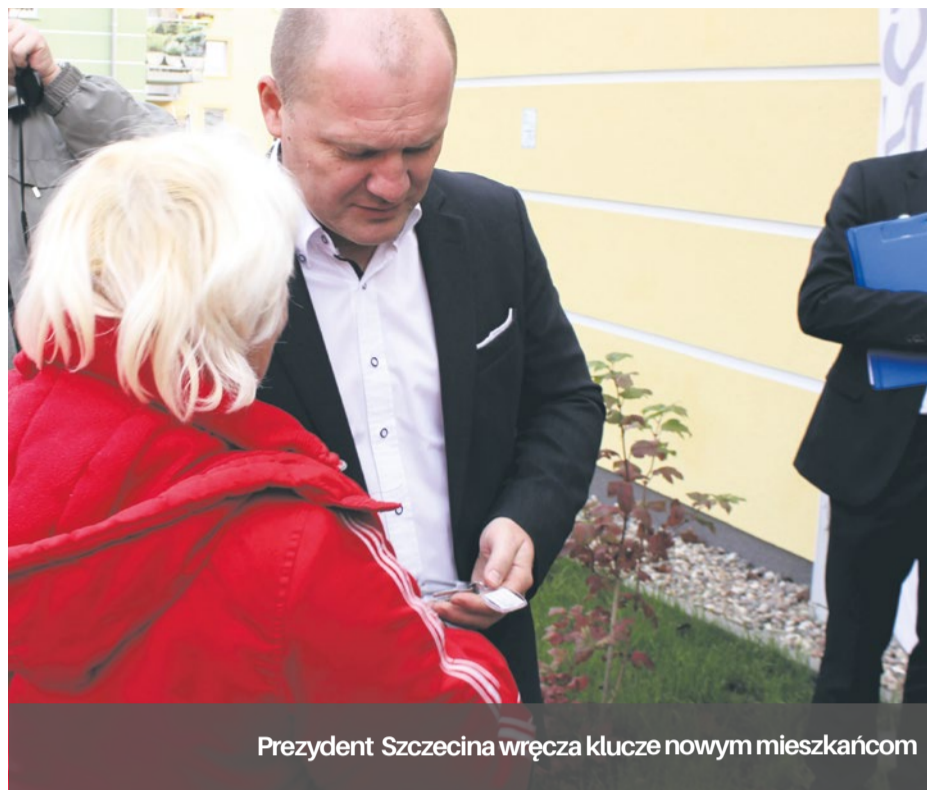
Prezydent Szczecina wręcza klucze nowym mieszkańcom

Całą inwestycję zaplanowano do realizacji w sześciu etapach, w latach 2014 - 2020. W sumie, w tym okresie, powstanie 120 mieszkań w 10 budynkach wielorodzinnych. Lokale wykończane są w standardzie „pod klucz”, tj. posiadają m. in.: kucharki elektryczne, zlewozmywaki, wanny, umywalki, armaturę sanitarną, w pokojach – wykładziny we współczesnym standardzie, w łazienkach – terakotę oraz płytki ceramiczne, stolarkę okienną i drzwiową. Do niektórych lokali położonych w parterze przynależą ogródki przydomowe, zaś wszystkie mieszkania położone na piętrach posiadają balkony. Część