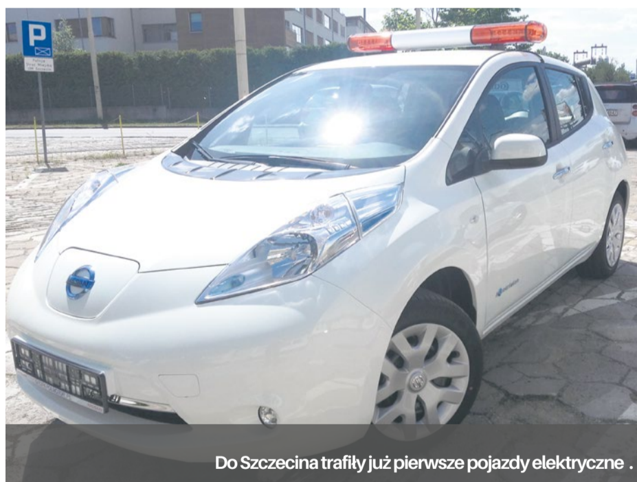
Do Szczecina trafiły już pierwsze pojazdy elektryczne.

W miejskim powietrzu będzie mniej spalin! Szczecin ekologicznie modernizuje swoją flotę pojazdów i kupuje kolejne auta elektryczne, ogłoszono także przetarg na zakup autobusów hybrydowych.