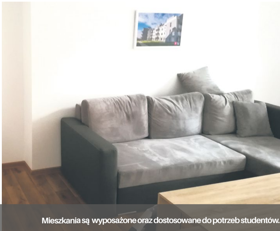
Mieszkania są wyposażone oraz dostosowane do potrzeb studentów.

Z początkiem roku akademickiego kolejni studenci zamieszkali w lokalach przygotowanych przez miasto. Tym razem do czterech mieszkań Szczecińskiego TBS wprowadziło się 17 żaków.