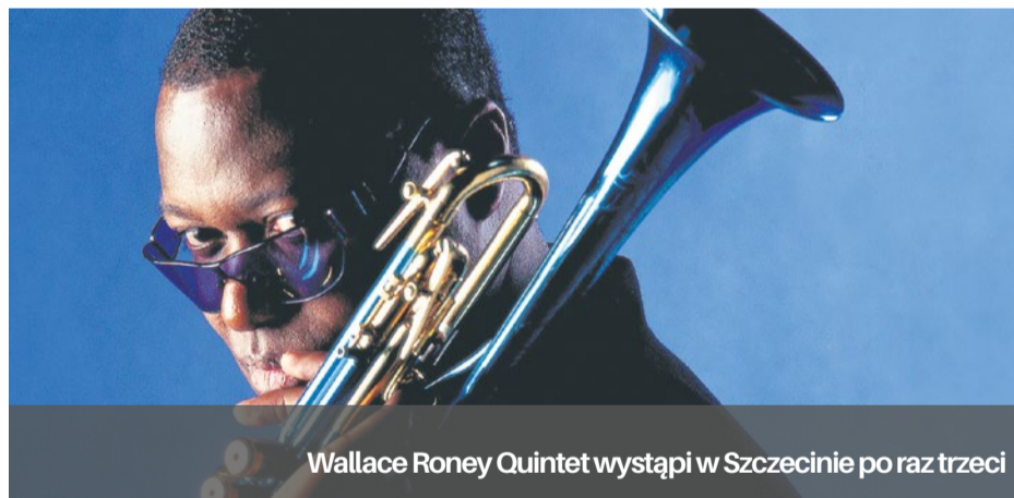
Wallace Roney Quintet wystąpi w Szczecinie po raz trzeci

Przygotowania trwają, choć do festiwalu jeszcze kilka miesięcy.