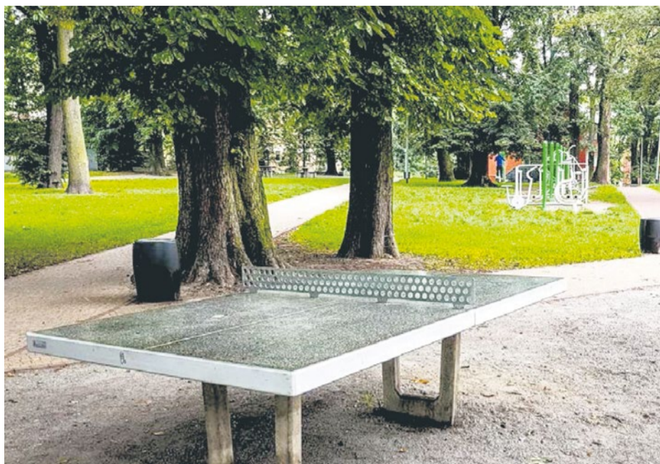
Park im. Nadratowskiego