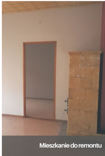
Mieszkanie do remontu

Każdy wniosek zostanie poddany ocenie punktowej, w oparciu, o którą sporządzony zostanie wykaz złożonych wniosków. Liczba punktów zależeć będzie między innymi: od okresu zamieszkiwania w Szczecinie,