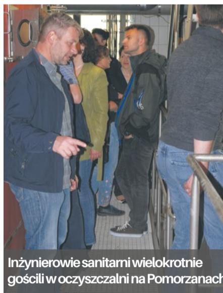
Inżynierowie sanitarni wielokrotnie gościli w oczyszczalni na Pomorzanych

ZWiK podpisał umowę o współpracy z Zachodniopomorskim Uniwersytetem Technologicznym.