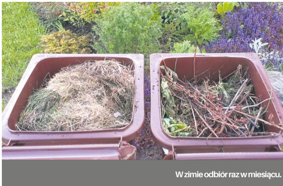
W zimie odbiór raz w miesiącu.

Zgłoszenia powinny być kierowane bezpośrednio do firm, które obsługują konkretne sektory miasta.