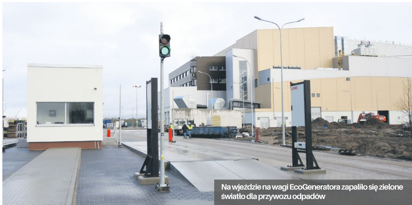
Na wjeździe na wagi EcoGeneratora zapaliło się zielone światło dla przywozu odpadów