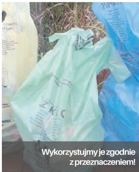
Wykorzystujmy je zgodnie z przeznaczeniem!

Sektor II - Suez Jantra Sp. z o.o. , ul. Księżnej Anny 11, 70-671 Szczecin