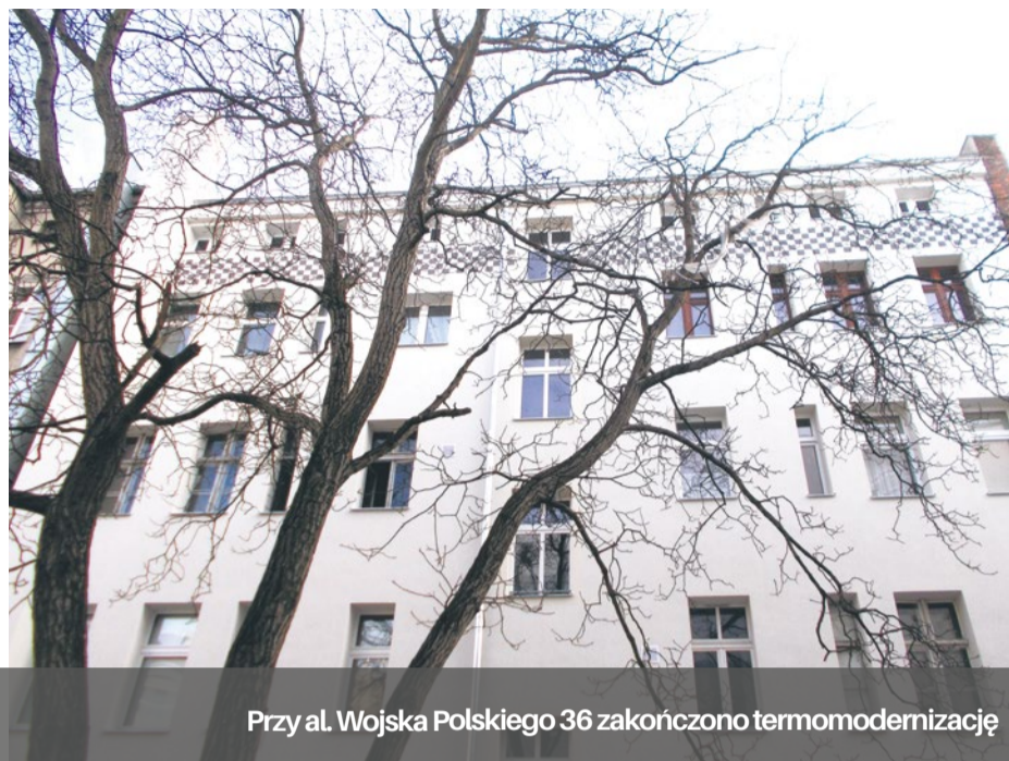
Przy al. Wojska Polskiego 36 zakończono termomodernizację

Szczecińskie TBS realizuje szereg inwestycji, które przyczyniają się do poprawy jakości powietrza w mieście.