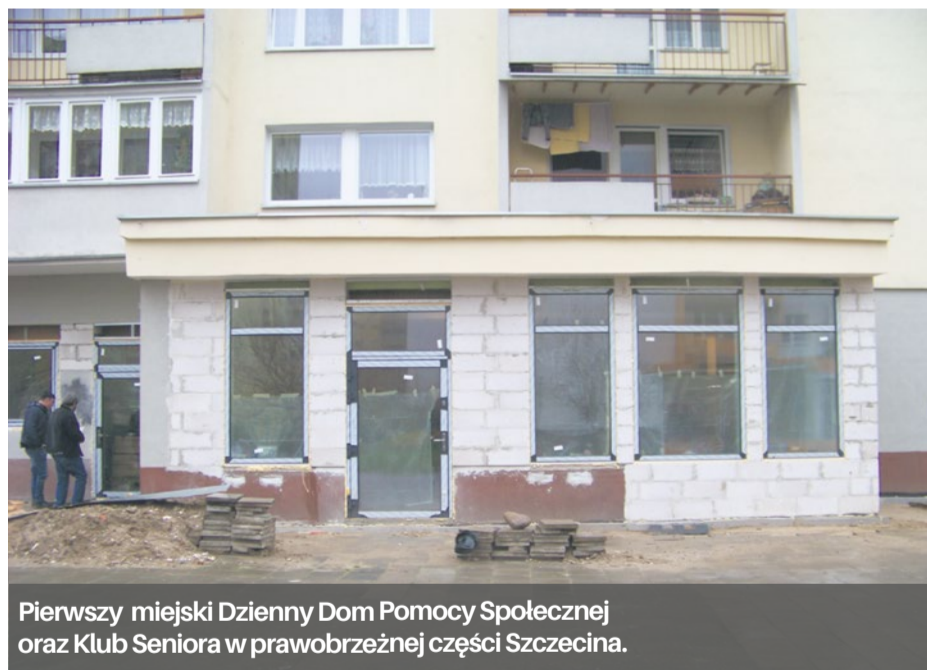
Pierwszy miejski Dzieniowy Dom Pomocy Społecznej oraz Klub Seniora w prawobrzeżnej części Szczecina.

Kończą się prace związane z budową pierwszego miejskiego Dziennego Domu Pomocy Społecznej oraz Klubu Seniora w prawobrzeżnej części Szczecina.