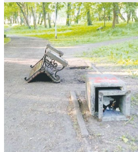
Wandale zniszczyli ławki w Parku Chopina.