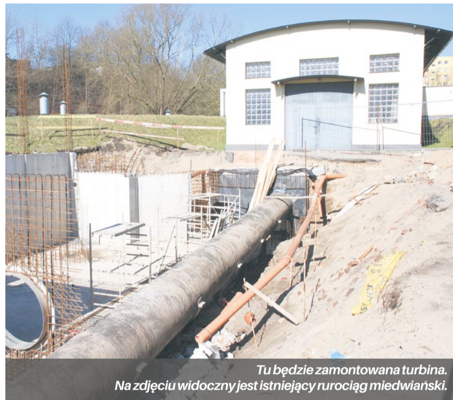
Tu będzie zamontowana turbina. Na zdjęciu widoczny jest istniejący rurociąg miedwiański.