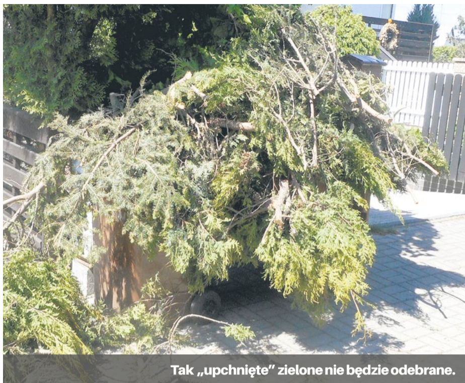
Tak „upchnięte” zielone nie będzie odebrane.