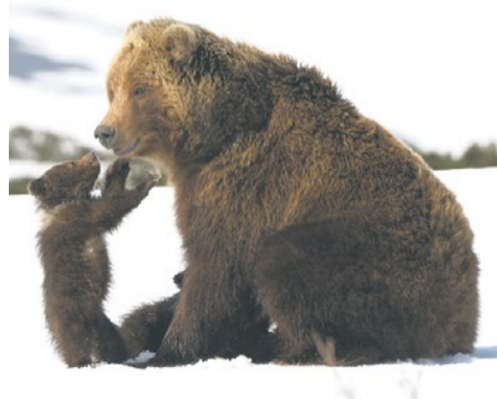
Kadr z filmu „Niedźwiedzie Kamczatki. Początek życia”