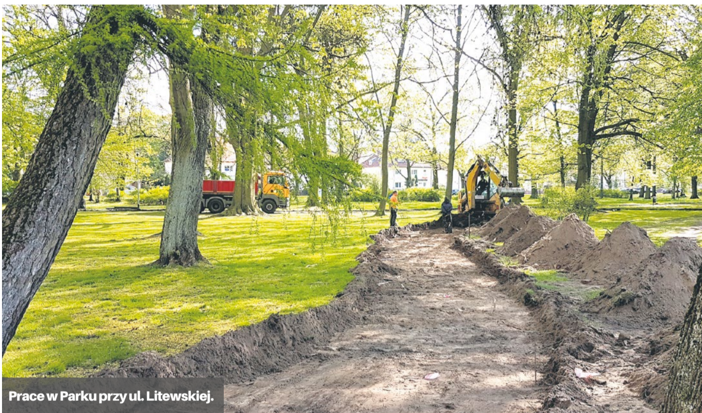
Prace w Parku przy ul. Litewskiej.