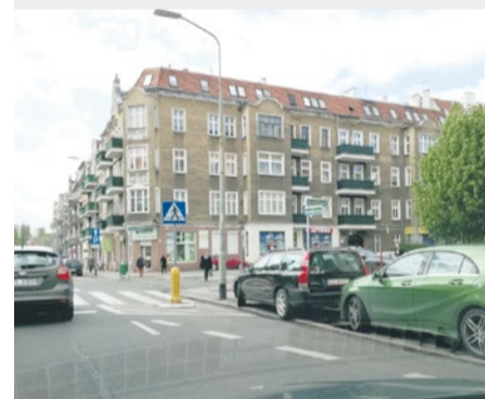
Parkowanie w niedozwolonych miejscach, to niestety częste zjawisko.