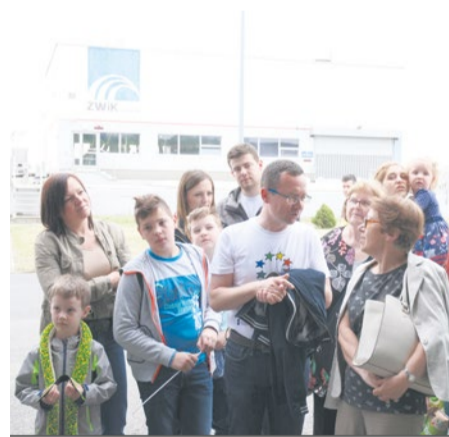
Zwiedzający byli bardzo ciekawi, jak funkcjonuje nowoczesna oczyszczalnia.

Ze względu na konieczność zapewnienia bezpieczeństwa, nie wchodzili do zamkniętych pomieszczeń. Nie przeszkodziło to im jednak zapoznać się z gospodarką osadową i energetyczną realizowaną w obiekcie. Zobaczyli z bliska