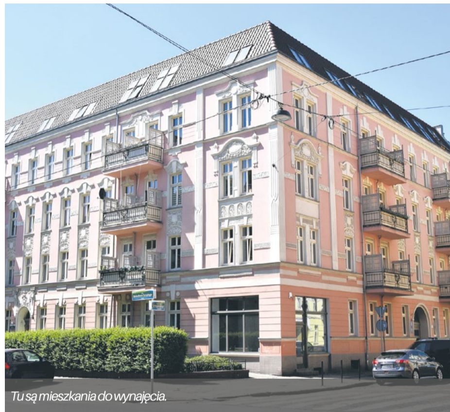
Tu są mieszkania do wynajęcia.

Można je także uzyskać osobiście w siedzibie ZBiLK. Informacje na temat zasad najmu mieszkań można również otrzymać pod nr telefonu: 91 48 86 333, 91 48 86 301, 91 43 45 455 (od pon do pt. w godz. od 7.30 do 15.30)