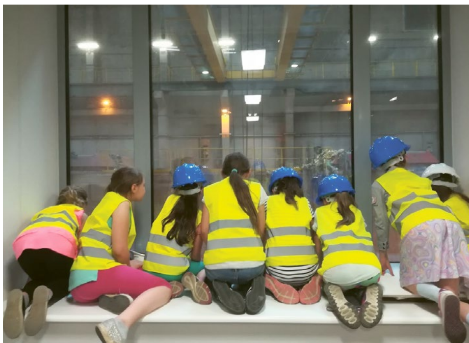
Zwiedzanie EcoGeneratora, uczniowie oglądają bunkier odpadów.

Strona Technikum Kształtowania Środowiska w Szczecinie Dąbju