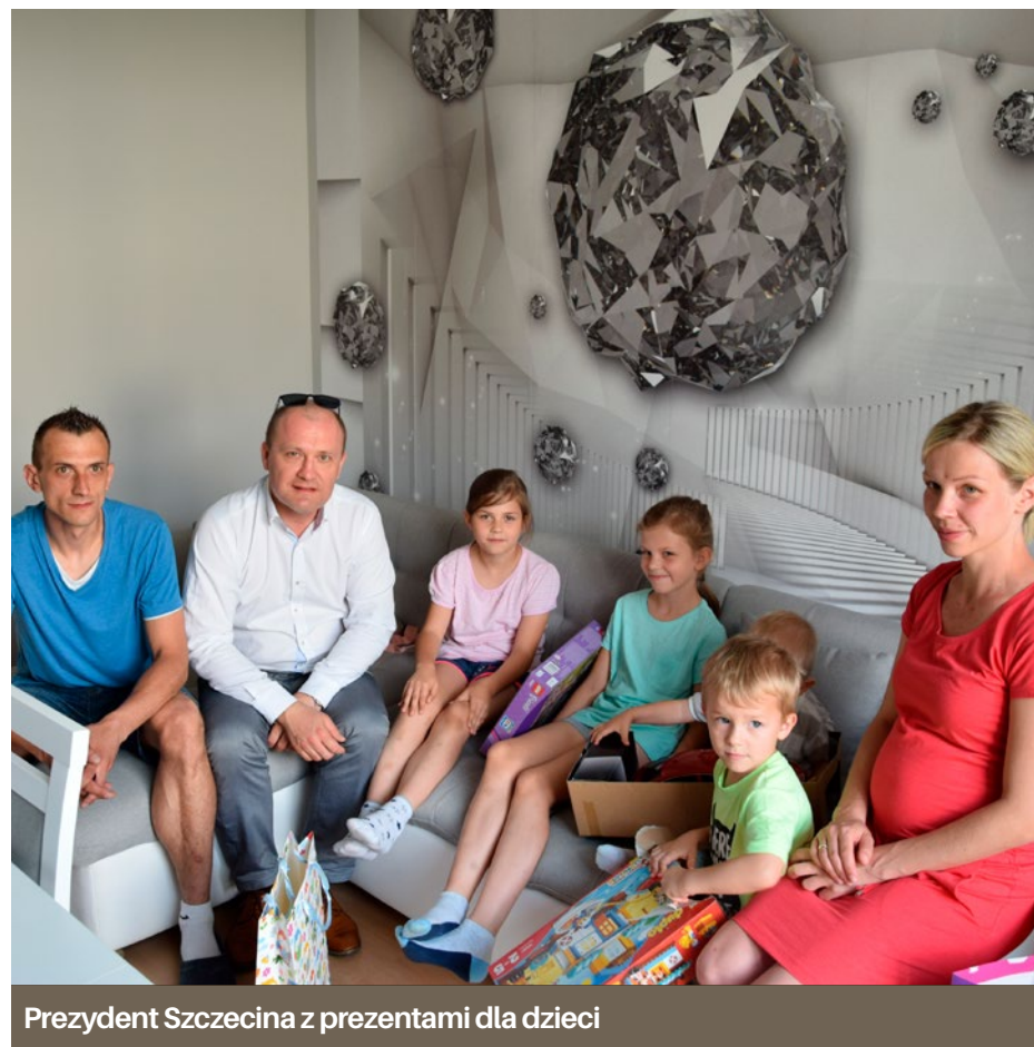
Prezydent Szczecina z prezentami dla dzieci