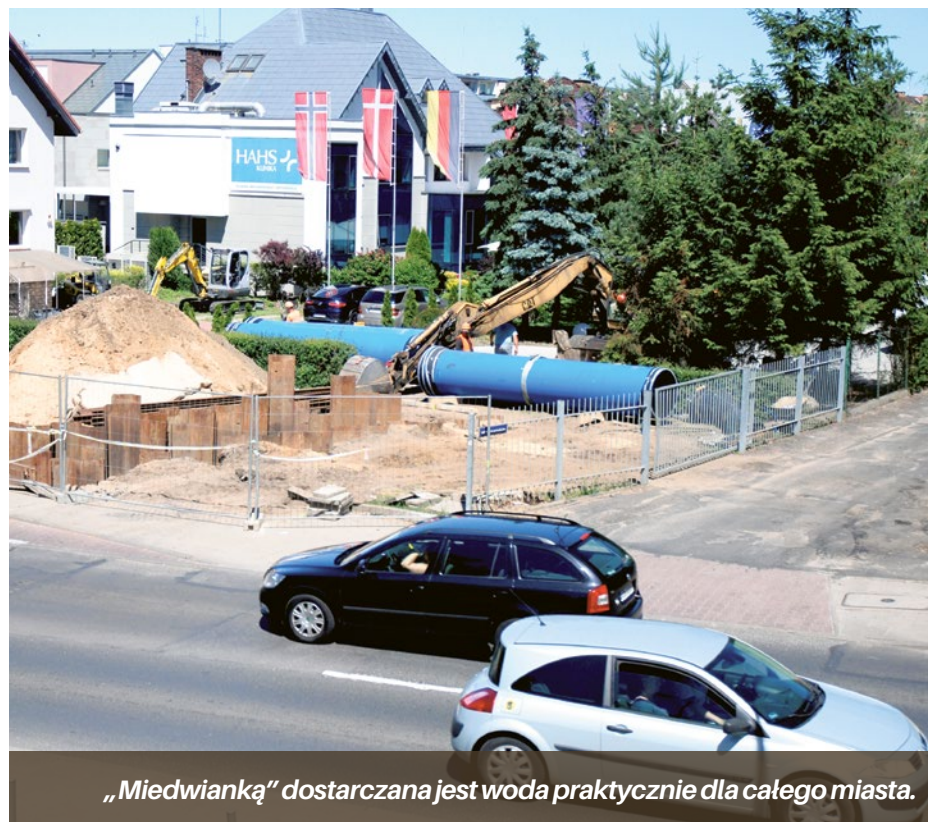
„Miedwianką” dostarczana jest woda praktycznie dla całego miasta.