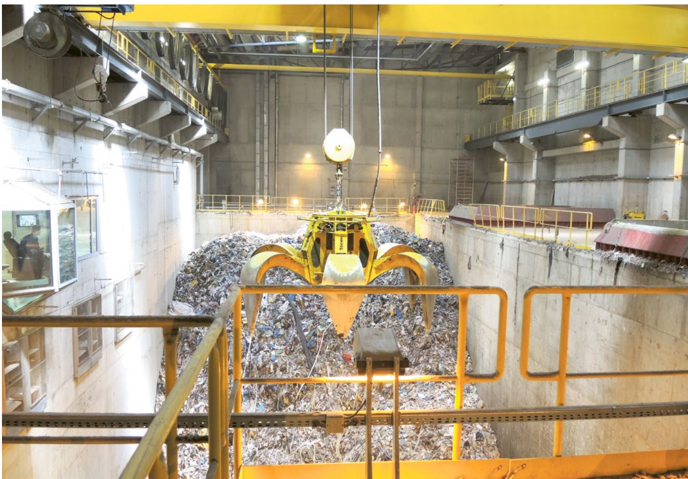
Wielka łapa, czyli chwytak łupinowy w bunkrze odpadów.

Pierwszy sezon zwiedzania EcoGeneratora za nami. Zakład odwiedziło 1410 osób w 61 grupach! Największe wrażenie robią ogień na ruszcie i wielka łapa w bunkrze odpadów.