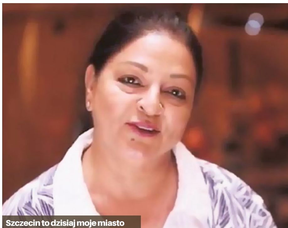
Szczecin to dzisiaj moje miasto

W ramach inicjatywy Codziennie Polskę tworzyMY restauratorka podzieliła się także swoimi refleksjami na temat wolności: - Wolność oznacza dla mnie to, że mogę się realizować, jestem akceptowana i nie czuję się inna - mówi nasza bohaterka . - Wolność to, oprócz zdrowia, największą wartością w naszym życiu. Kiedy człowiek jest wolny ma pozytywną energię. Dlatego musimy o tę wolność dbać.