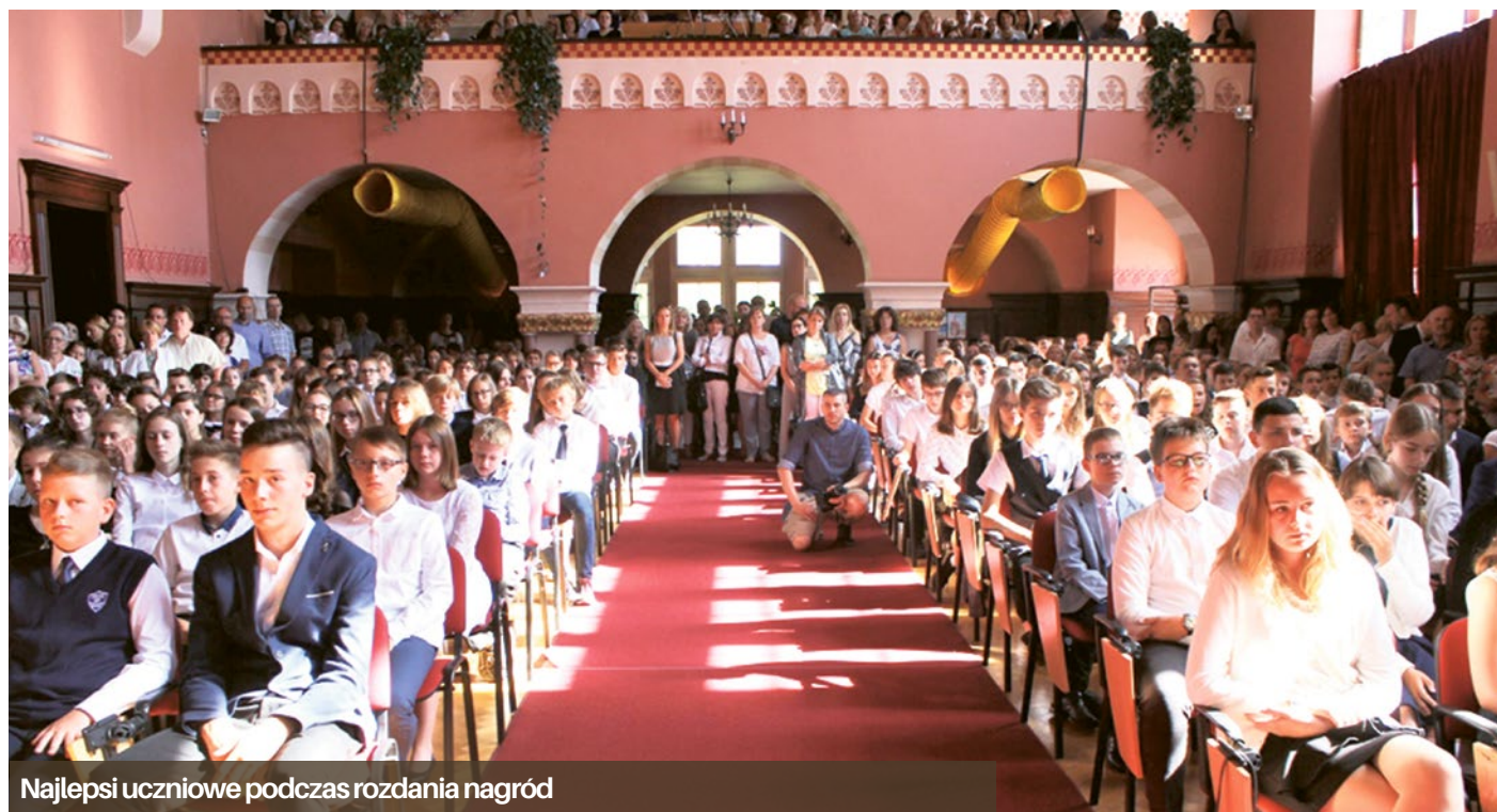
Najlepsi uczniowie podczas rozdania nagród