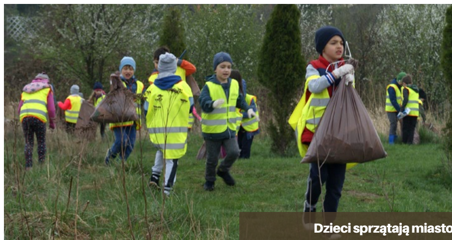
Dzieci sprzątają miasto

W tym roku akcję zainaugurowali uczniowie ze Szkoły Podstawowej nr 69 , którzy uporządkowali teren wokół szkoły. Przez kilka godzin uczniowie zebrali ponad 160 kg odpadów . Najwięcej odpadów, bo ok. 420 kilogramów zebrali uczniowie ze Szkoły Podstawowej nr 69 mieszczącej