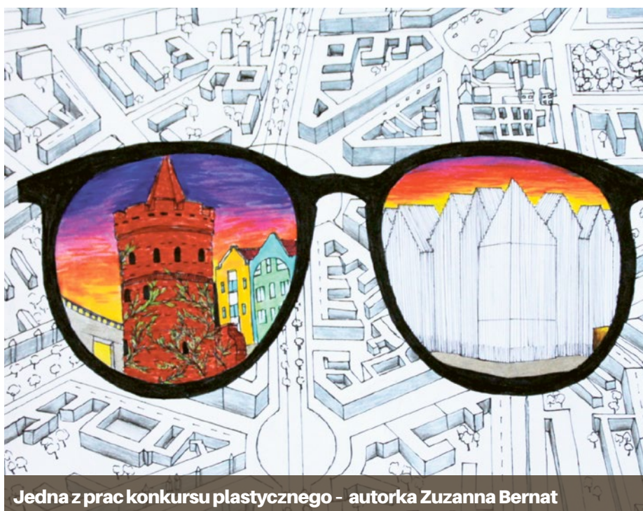
Jedna z prac konkursu plastycznego - autorka Zuzanna Bernat