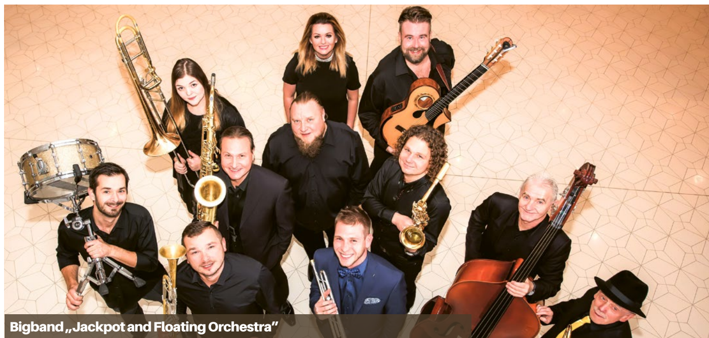
Bigband „Jackpot and Floating Orchestra”

Dwa urodzinowe torty, po 73 kg każdy, koncerty, warsztaty dla dzieci, wystawy oraz wyjątkowa potańcówka - to atrakcje przygotowane z okazji urodzin miasta, podczas których będziemy świętować również Dzień Pionierów Miasta Szczecina.