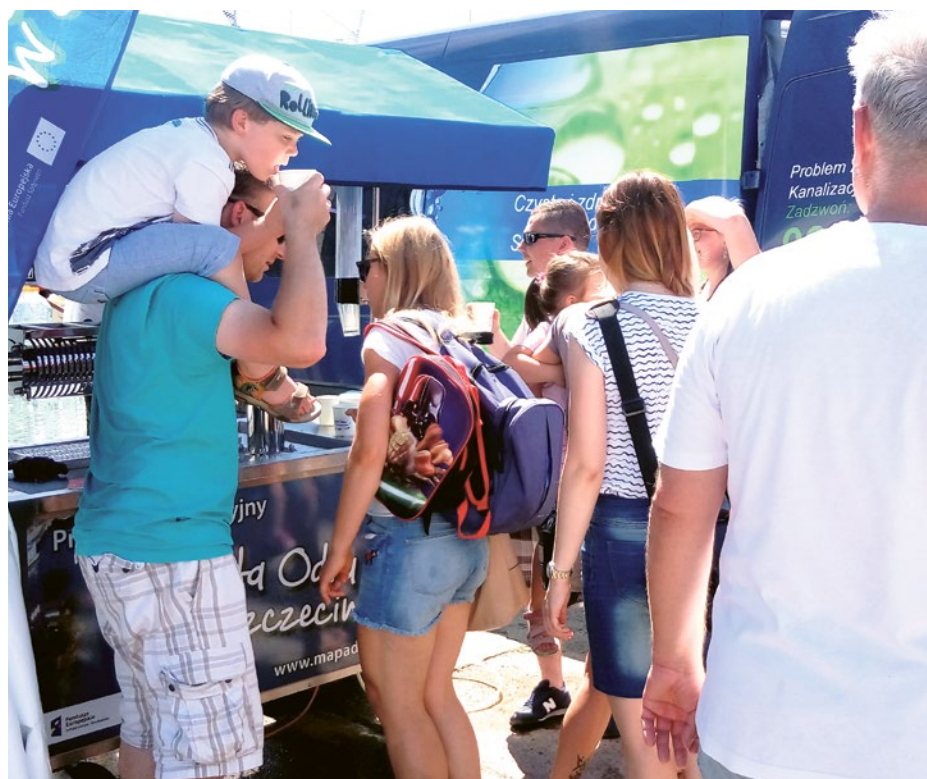
Hitem podczas tegorocznych Dni Morza był saturator na stoisku ZWiK.

Jak co roku, ZWiK prezentował się podczas Dni Morza. Bez wątpienia hitem naszego stoiska był saturator, z którego rozdawaliśmy wodę gościom największej szczecińskiej imprezy plenerowej. Kto jej nie spróbował, ma na to szansę podczas kolejnych wydarzeń odbywających się w mieście.