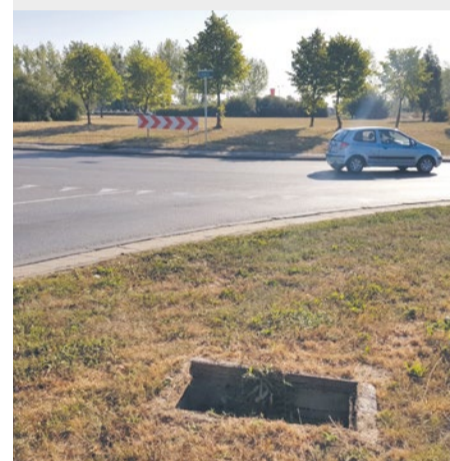
Rondo Hakena, brak pokrywy studzienki.