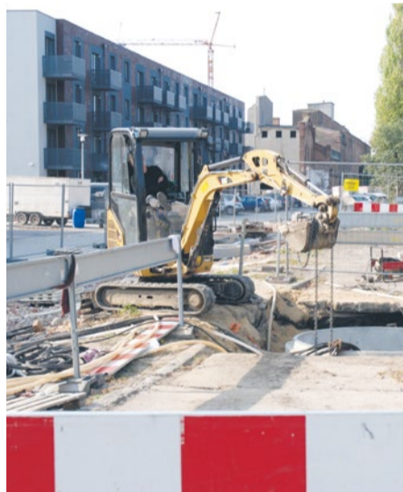
Prace na ul. Cukrowej.

Do końca roku skanalizowany będzie kolejny fragment miasta.