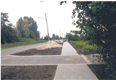
Chodnik przy ul. Marynarskiej

Wyspy Puckiej zdecydowano o lokalizacji drugiego, podobnego domku na terenie boiska, który posłuży dzieciom jako świetlica.