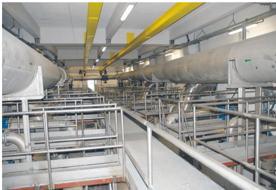
Odnowiona galeria rurociągów

ZWiK ukończył modernizację galerii rurociągów w Zakładzie Produkcji Wody „Miedwie”.