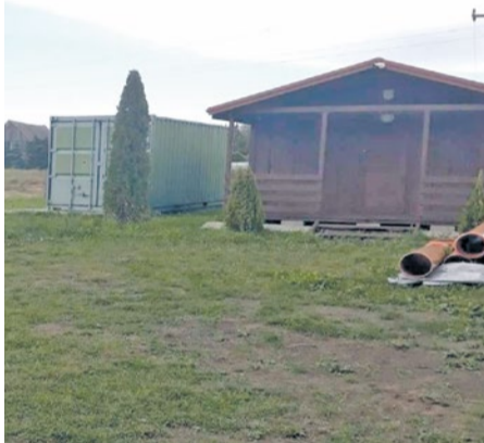
Domek na boisku przy ul. Marynarskiej

Uwzględniając potrzeby mieszkańców jak również konieczność zorganizowania czasu wolnego małym mieszkańcom