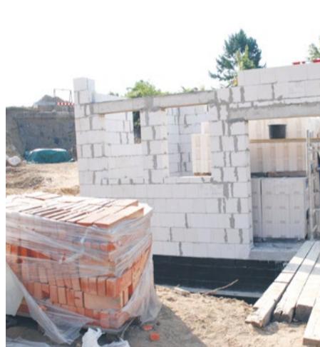
Budowa nowej pompowni wody.

Trwa remont zbiorników wody pitnej przy ul. Lechickiej.