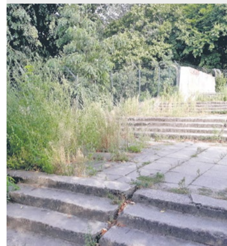
Walczaka schody zarośnięte chwastami.