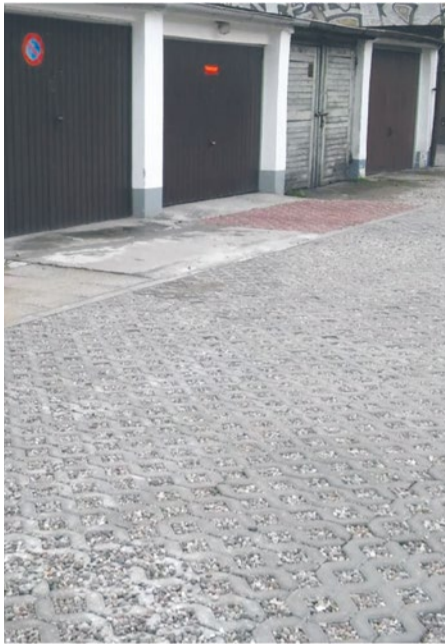
Nowa nawierzchnia przy garażach na ul. Niedziałkowskiego

Dobry podjazd do garażu znacząco usprawni komunikację. To inwestycja na wiele lat, warto więc starannie ją zaprojektować. Te i inne przesłanki zadecydowały o tym, iż Rada Osiedla Śródmieście Północ zdecydowała się ucywilizować właścicielom garaży zlokalizowanych przy ul. Niedziałkowskiego wjazd samochodami. Podjazd do garażu przez cały rok jest narażony na działanie niekorzystnych warunków atmosferycznych oraz znacznych obciążeń. Teren od wielu lat zaniedbany i zabłocony, zyskał nowe oblicze. Inwestycję zrealizował Zarząd Budynków i Lokali Komunalnych.