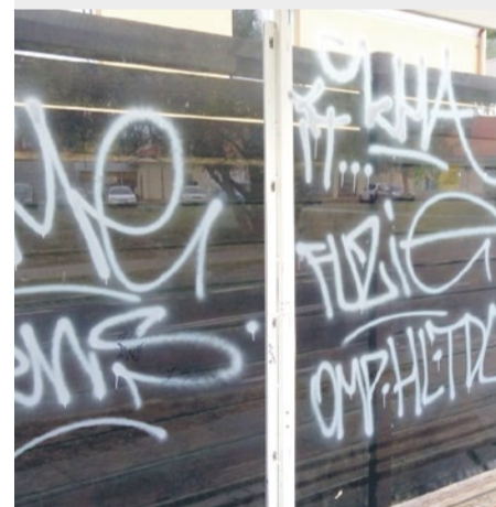
Pomazany przystanek, ul. Chorzowska

Z nowej ulepszonej wersji aplikacji Alert Szczecin 2.0 można korzystać w urządzeniu mobilnym (telefon, tablet) opartym na Androidzie, systemie iOS czy Windows Phone.