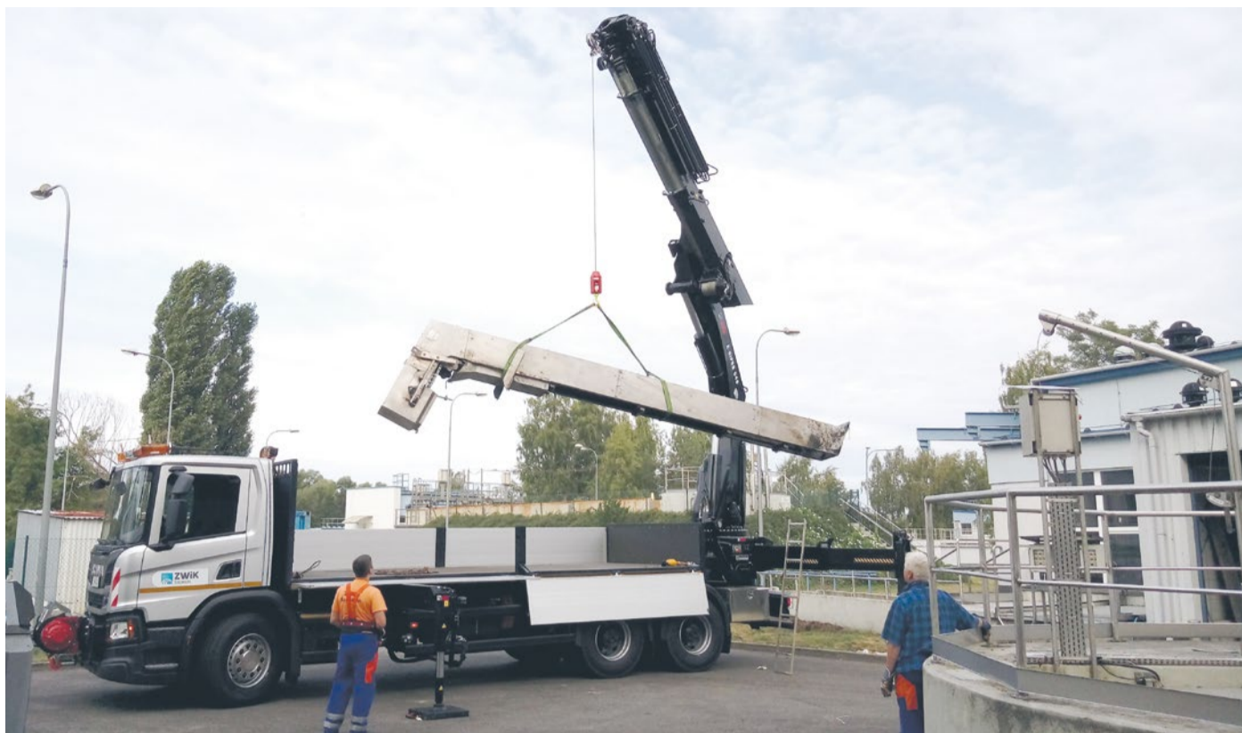
Nowy dźwig w akcji

Urządzenie jest sterowane radiowo za pomocą specjalnego panelu. Ułatwia to operatorowi widoczność i poprawia sprawność obsługi. Żuraw jest wyposażony w elek-