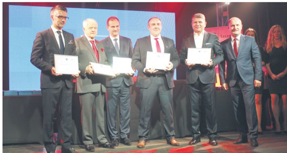
Laureaci Nagrody Gospodarczej

Nagroda Gospodarcza Prezydenta Miasta Szczecin została przyznana po raz drugi. Jej celem jest promowanie wyróżniających się firm z naszego miasta, inspirowanie rozwoju przedsiębiorstw, promowanie postaw proinwestycyjnych, wybitnych osiągnięć innowacyjnych oraz zwiększenie konkurencyjności szczecińskich przedsiębiorstw na arenie krajowej i międzynarodowej. Kandydatami do Nagrody Gospodarczej mogły zostać firmy, mające