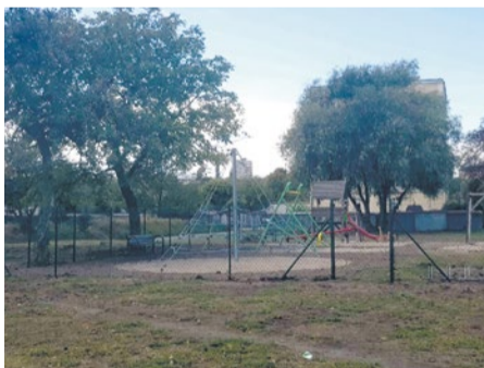
Plac zabaw przy ul. Maklerskiej zostanie przeniesiony na ul. Heyki

Dzięki temu mali mieszkańcy tej części Wyspy Puckiej zyskają więcej przestrzeni do aktywnego spędzania wolnego czasu.