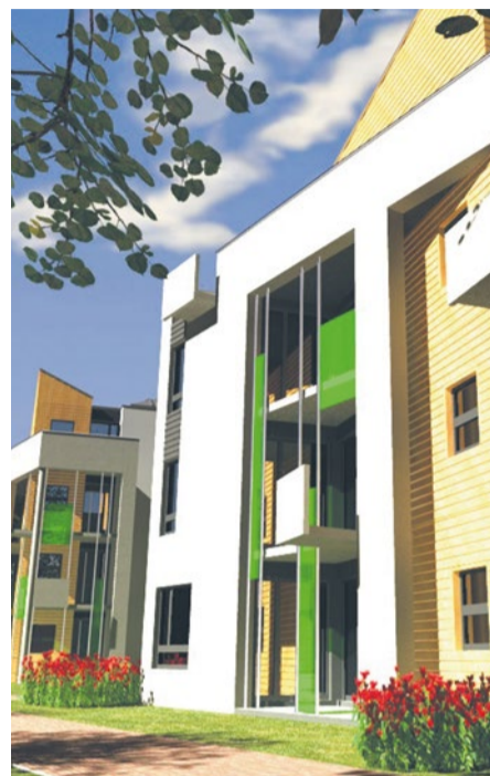
Osiedle przy ul. Drukarskiej w Dąbiu