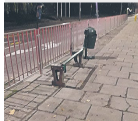
Zniszczona ławka na przystanku „Matejki” dla linii 5 i 11, w kierunku Placu Rodła.