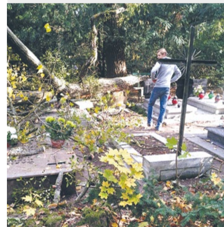
Cmentarz Centralny - spadł konar z drzewa na groby, na szczęście nikomu się nic nie stało.

Z nowej, ulepszonej wersji aplikacji Alert Szczecin 2.0 można korzystać w urządzeniu mobilnym (telefon, tablet) opartym na Androidzie, systemie iOS czy Windows Phone.