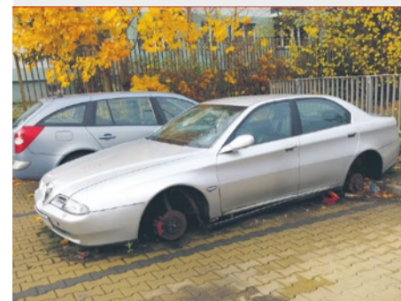
Wraki samochodów, ul. Wszystkich Świętych