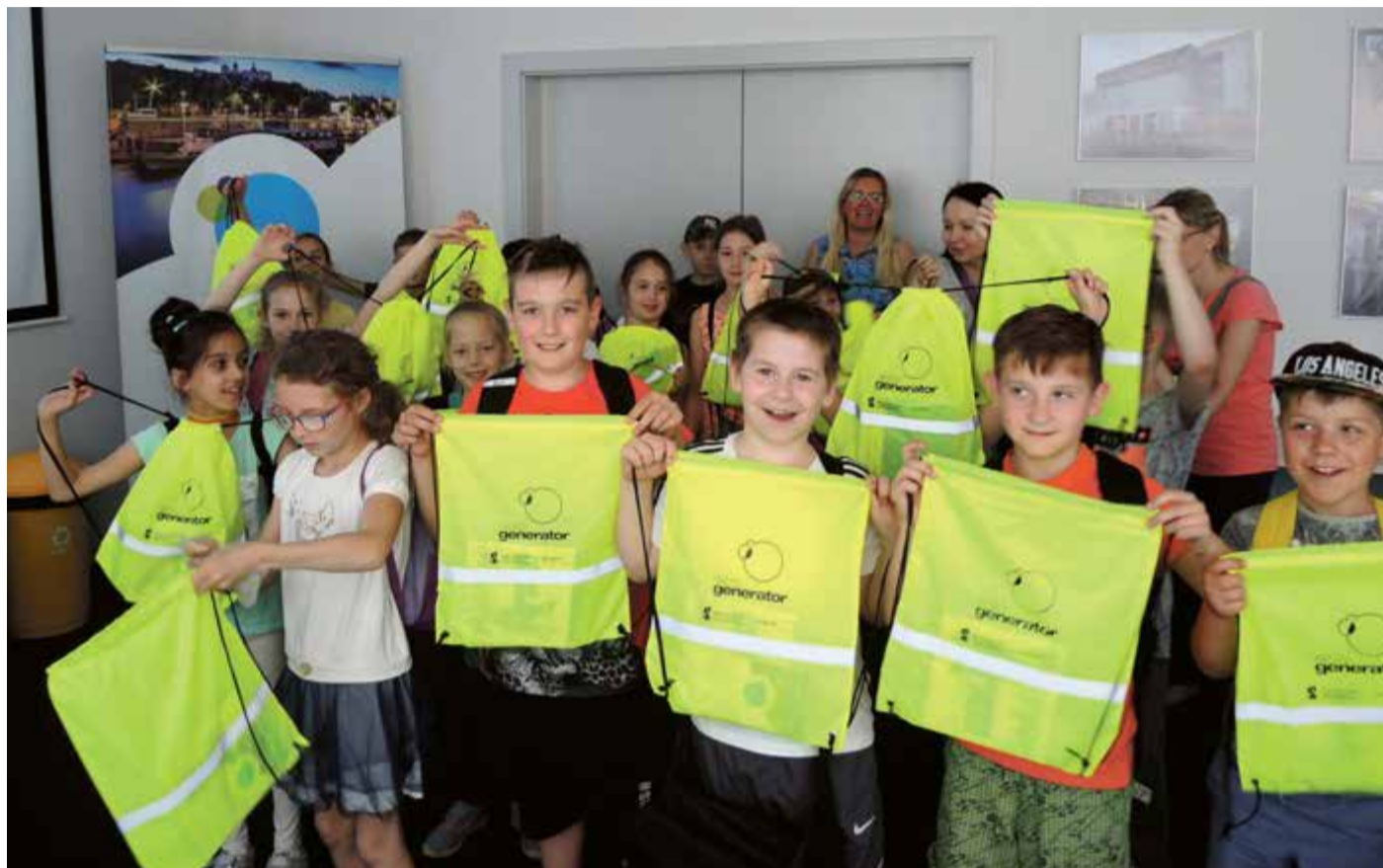
Zwiedzanie EcoGeneratora. N/z: uczniowie i opiekunowie klasy 3b z SP 12 w Szczecinie

„Niebo jest niebieskie, a trawa zielona, wyszłam szczęśliwa z EcoGeneratora!”