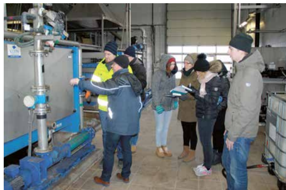
Wizyta audytorów w oczyszczalni „Pomorzan”

Projekt IWAMA jest współfinansowany z Europejskiego Funduszu Rozwoju Regionalnego w ramach Programu Regionu Morza Bałtyckiego INTERREG na lata 2014-2020. Całkowity budżet projektu: 4,6 mln EUR, a współfinansowanie z EFRR wynosi 3,7 mln EUR.