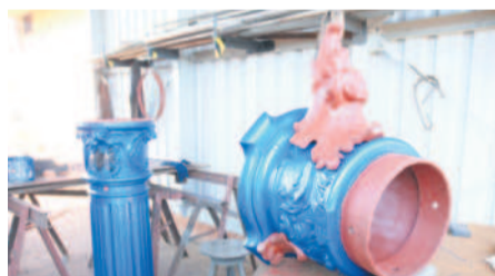
Pompa w naszym warsztacie