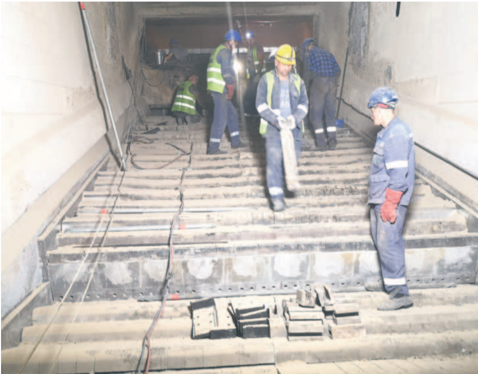
Remont pokładu rusztowego kotła