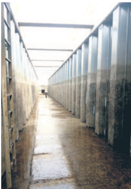
Przegląd kanału dolotowego

Jego znaczenie jest ogromne. Inwestycja zapewnia energię elektryczną i ciepłą do ok. 30 tys. gospodarstw domowych, biodegradowalna frakcja odpadów komunalnych i przemysłowych jest uważana za biomasę, a zatem odnawialne źródło energii. EcoGenerator unieszkodliwia blisko 150 tys. ton odpadów rocznie.