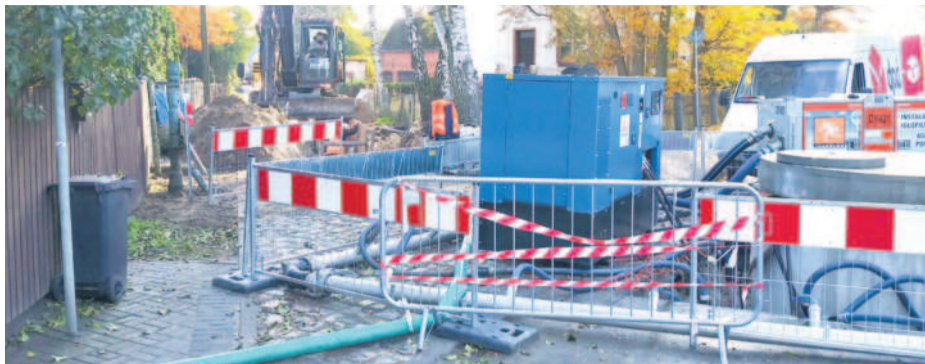
Układanie sieci kanalizacyjnej jest trudne w wąskich uliczkach prawobrzeżnych osiedli.

Wywóz szamba kosztuje trzykrotnie więcej niż odprowadzenie ścieków do kanalizacji sanitarnej. I jest to nie tylko tańsze. Przede wszystkim jest przyjazne środowisku, bo ścieki z nieszczelnych szamb nie wnikają w glebę i wody gruntowe na naszych posesjach.