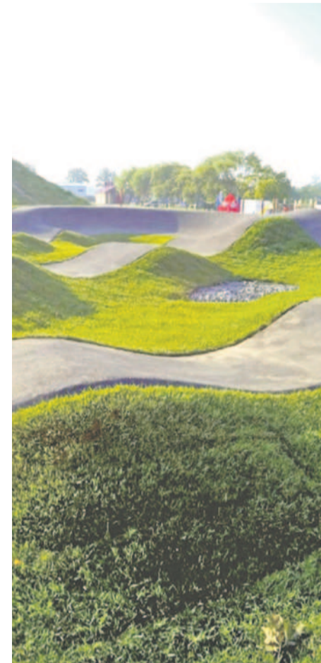
Pierwszy pumptrack w Szczecinie, przy ul. Twardowskiego.

Jest już gotowy projekt kolejnego pumptracku, który tym razem powstanie w Wielgowie. Inwestycja to zasługa mieszkańców, którzy zagłosowali na ten pomysł w Szczecińskim Budżecie Obywatelskim.