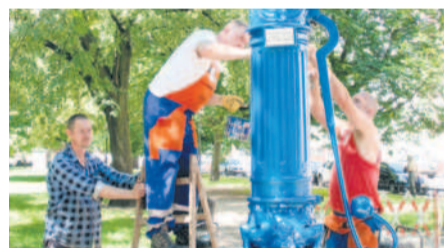
Montaż odnowionej pompy przy ul. E. Bałuki

Jesteśmy z nich dumni, gdyż to dzięki staraniom naszych mechaników odzyskały blask i cieszą szczecinian, a także odwiedzających nasze miasto. Historyczne XIX-wieczne pompy uliczne, bo o nich mowa, stały się właśnie atrakcją turystyczną i „dorobiły się” własnego szlaku.