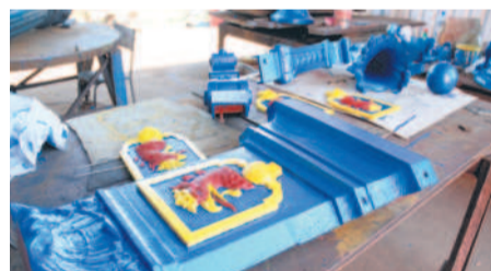
Odnowione detale „berlinki”