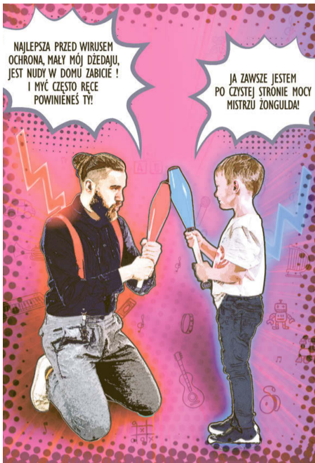
Twoje zdrowie jest w Twoich czystych rękach.