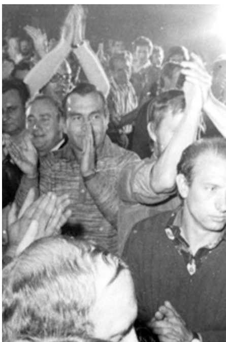
1980. Jedno plemię.