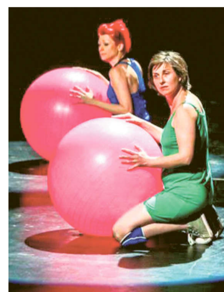
Teatr Kana „PROJEKT: MATKA”