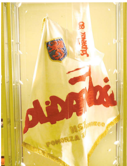
Wystawa „Moja Solidarność”