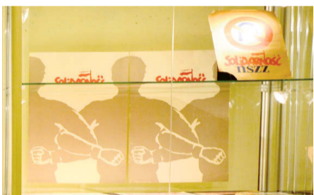
Wystawa „Moja Solidarność”