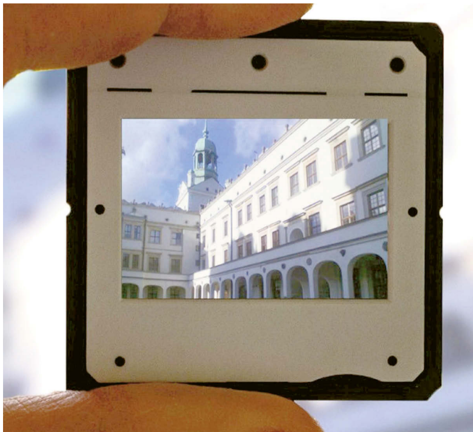
41. Pomorskie Spotkania z Diaporamą

75 książek na 75. rocznicę ustanowienia polskiej administracji na Pomorzu