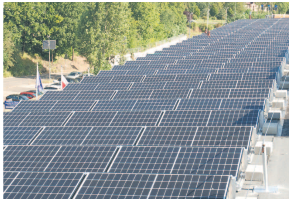
Mini farma na dachu biurowca przy ul. Golisza

Dzięki od lat prowadzonym inwestycjom w odnawialne źródła energii, ZWiK bez wątplenia jest dzisiaj liderem w regionie w ilości produkowanej zielonej energii. Aktualnie uzyskuje ją z pięciu farm fotowoltaicznych, turbiny prądotwórczej Francisa oraz z zespołów gazogeneratorów w oczyszczalniach ścieków. Już 23% całego zapotrzebowania firmy w energię elektryczną zaspokajane jest z „własnych elektrowni”. Wszystkie zastosowane rozwiązania służą racjonalizacji kosztów zakupu i zużycia prądu, co z kolei od lat pozwala utrzymywać opłaty za wodę i odbiór ścieków ponoszone przez szczecinian na podobnym poziomie. Same instalacje umiejscawiane i budowane są „na miarę”: zaopatrują w prąd placówkę najbliższą położoną i całość produkcji zużywana jest bezpośrednio na potrzeby pompowni, zakładu produkcji wody lub oczyszczalni ścieków.