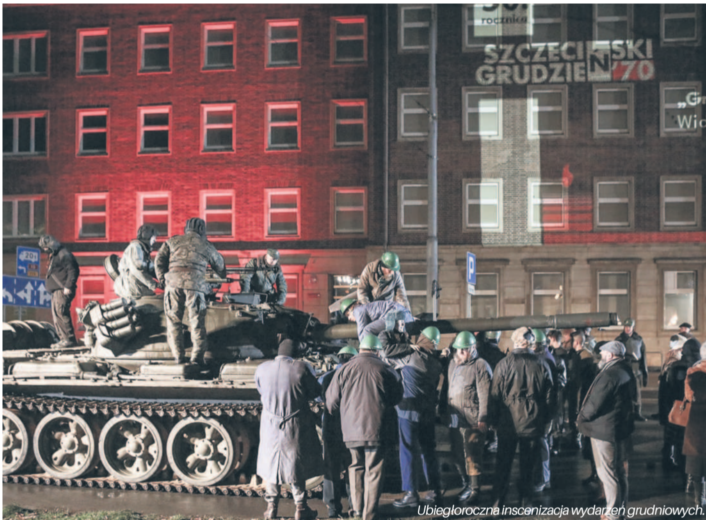
Ubiegłoroczna inscenizacja wydarzeń grudniowych.