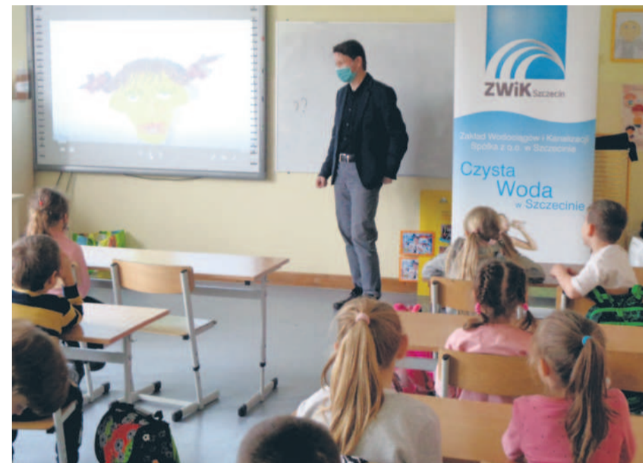
Lekcja w szkole przy ul. Brodnickiej

O wodzie, jej znaczeniu dla życia i pracy szczecińskich wodociągów rozmawiali niedawno pracownicy ZWiK z pierwszoklasistami i seniorami.