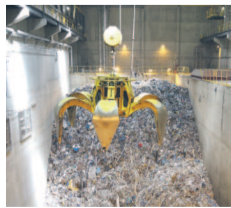
Chwytnik łupinowy w bunkrze odpadów.