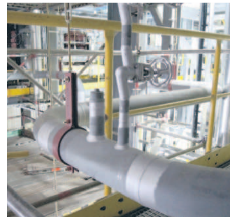
Fragment rurociągu do obiegu pary.