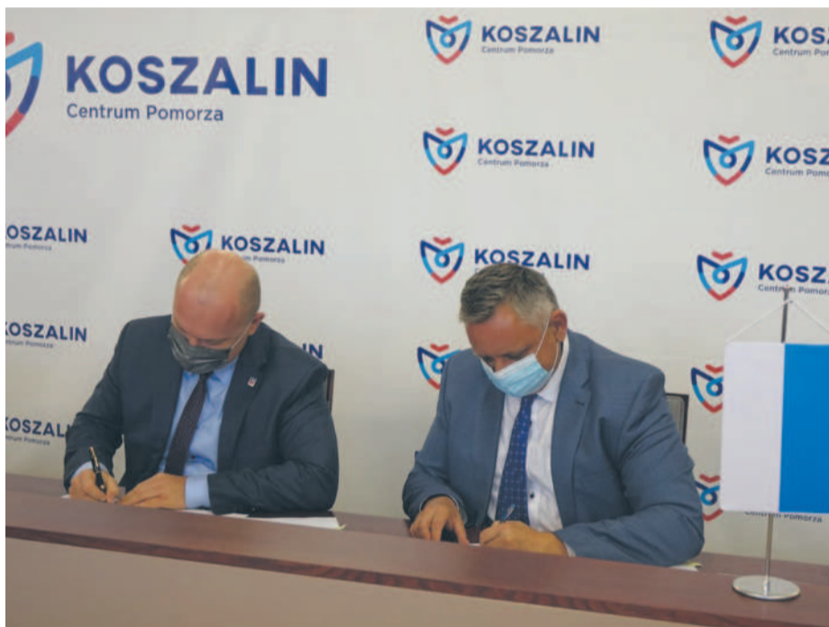
Podpisanie umowy przez prezydentów Szczecina i Koszalina.