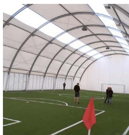
Kryte boisko w kompleksie przy ul. Stołczyńskiej

Zmieniają się ulice w naszym mieście, ale prowadzonych jest również wiele innych inwestycji, w tym obiektów sportowych.