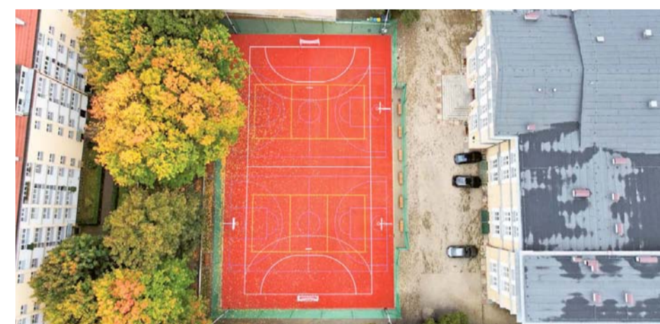
Nowe boisko przy IX Liceum Ogólnokształcącym.