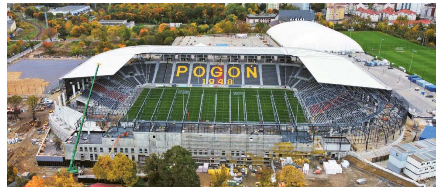
Budowa Stadionu Miejskiego już coraz bliżej finału