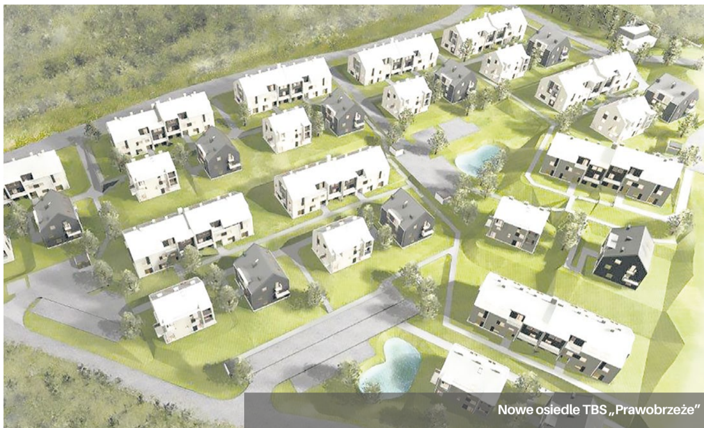
Nowe osiedle TBS „Prawobrzeże”

Na osiedlu będzie 280 mieszkań w 10 budynkach z trzema kondygnacjami