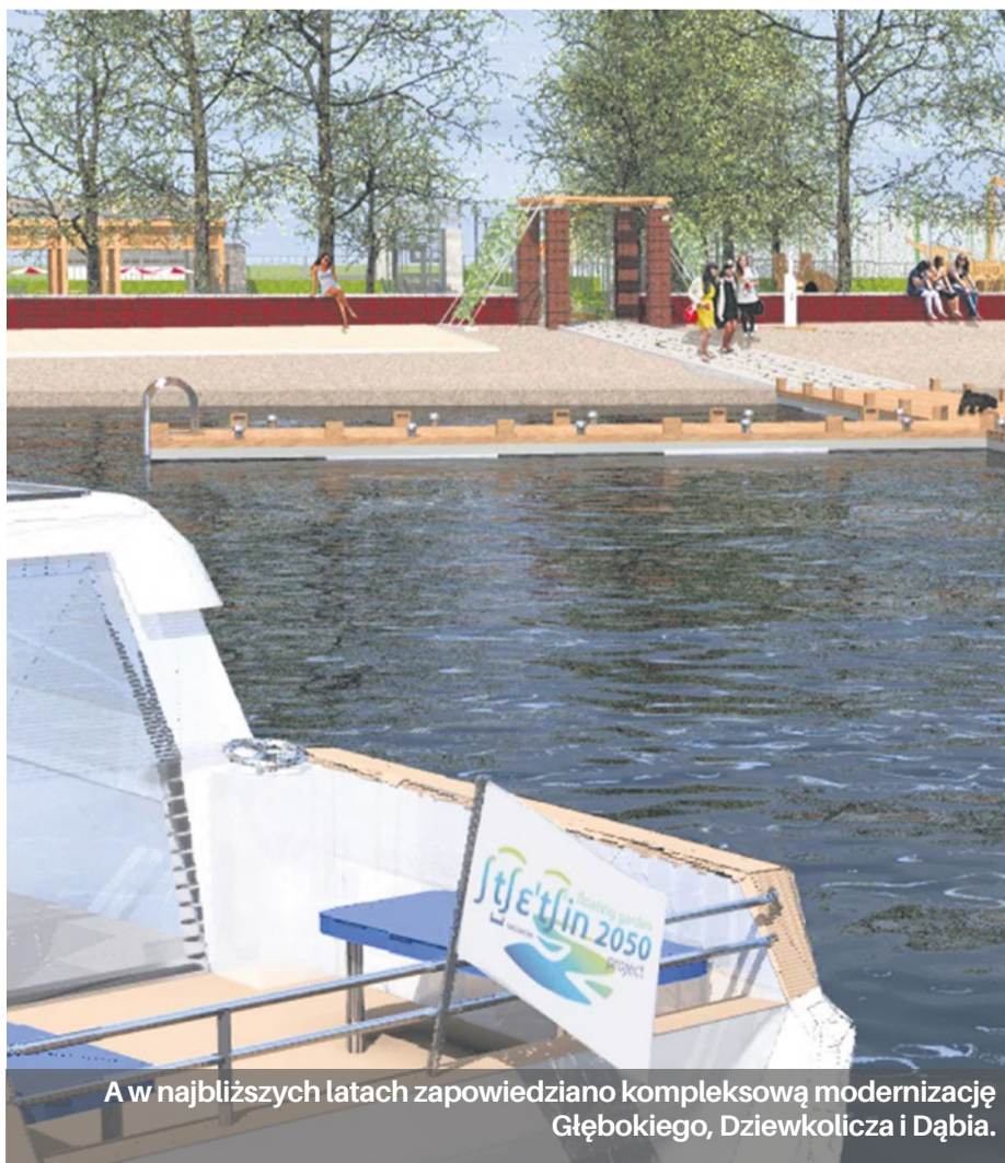
A w najbliższych latach zapowiedziano kompleksową modernizację Głębokiego, Dziewoklicza i Dąbia.

Przy kasach wejściowych oraz przy parkingu zamontowane zostały elektroniczne wyświetlacze.