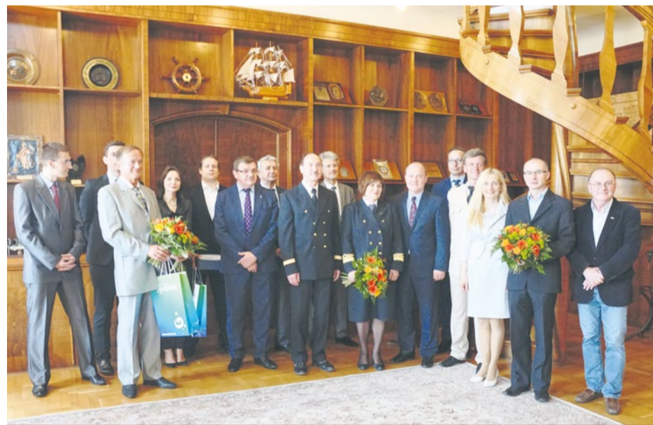
Nagrodzeni za najlepsze prace dyplomowe magisterskie i doktorskie ukierunkowane na nowoczesne technologie i innowacje.

Pięcioro uzdolnionych naukowców otrzymało nagrody od prezydenta Szczecina Piotra Krzystka za najlepsze prace dyplomowe, magisterskie i doktorskie ukierunkowane na nowoczesne technologie i innowacje.