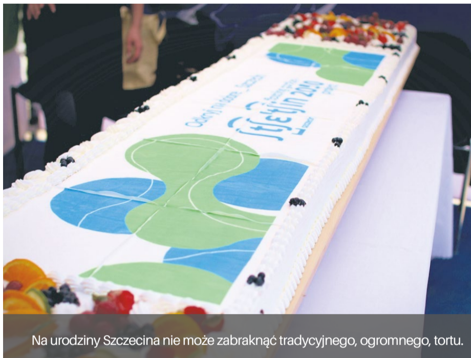
Na urodziny Szczecina nie może zabraknąć tradycyjnego, ogromnego, tortu.

Oczywiście, nie może także zabraknąć akcentów historycznych, nawiązujących do pierwszych lat powojennych Szczeci-