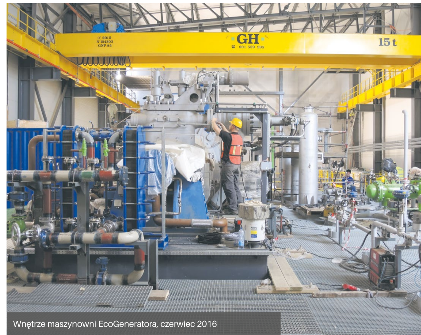
Wnętrze maszynowni EcoGeneratora, czerwiec 2016