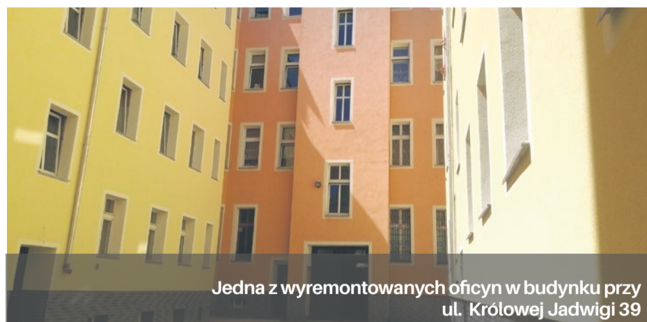
Jedna z wyremontowanych oficyn w budynku przy ul. Królowej Jadwigi 39

Widoczne są już pierwsze efekty dodatkowego wsparcia finansowego przeznaczone na remonty kamienic.