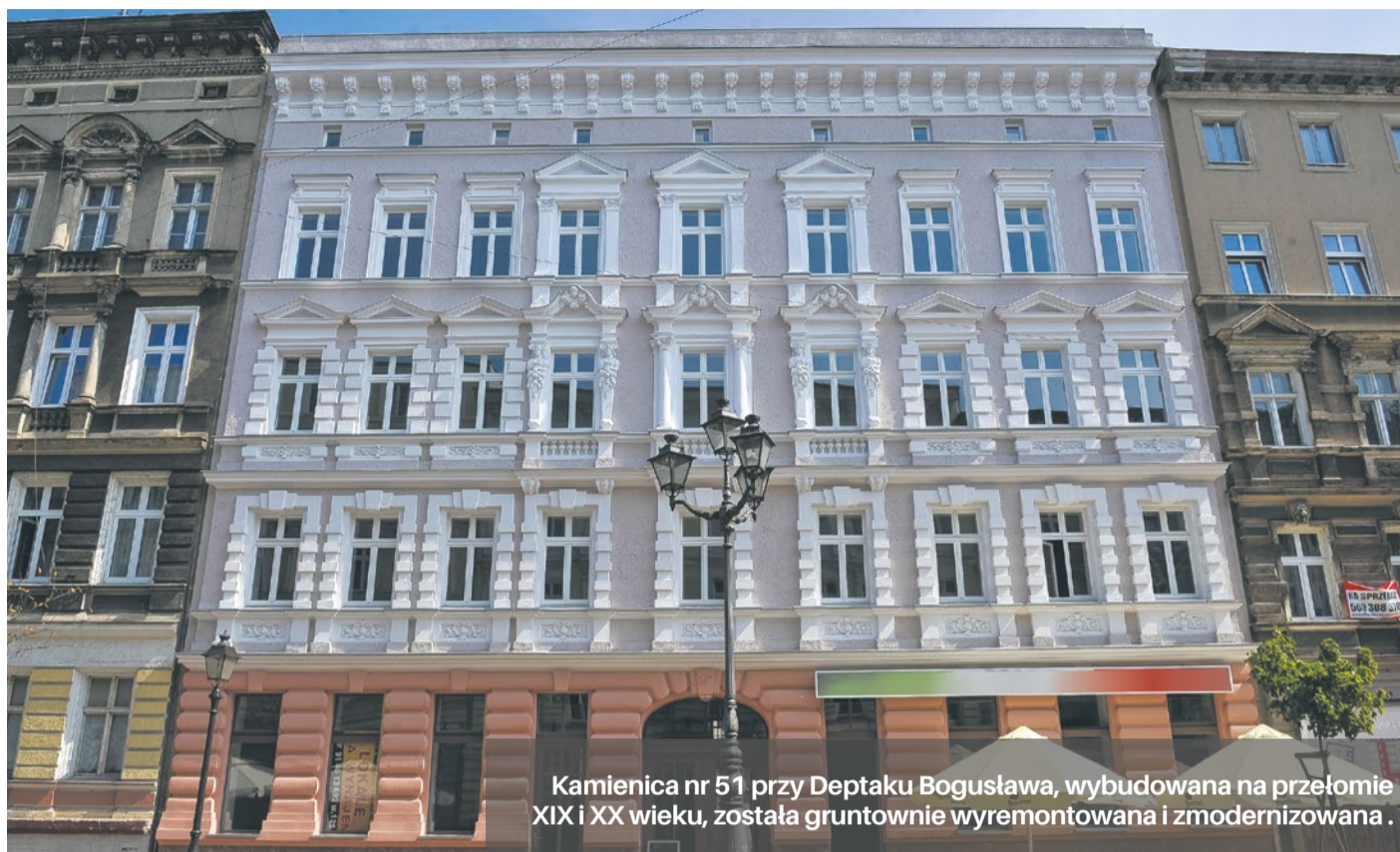
Kamienica nr 51 przy Deptaku Bogusława, wybudowana na przełomie XIX i XX wieku, została gruntownie wyremontowana i zmodernizowana.

Przyszli właściciele lokali mieszkalnych położonych przy ul. Bogusława X 51 będą członkami wspólnoty mieszkaniowej, zatem będą ponosić koszty utrzymania nieruchomości wspólnej tj. bieżącej konserwacji, utrzymania porządku w budynku, remontów, opłat za energię elektryczną w nieruchomości wspólnej, także utrzymania windy. Za dostarczanie media do mieszkań każdy właściciel będzie rozliczał się indywidualnie.