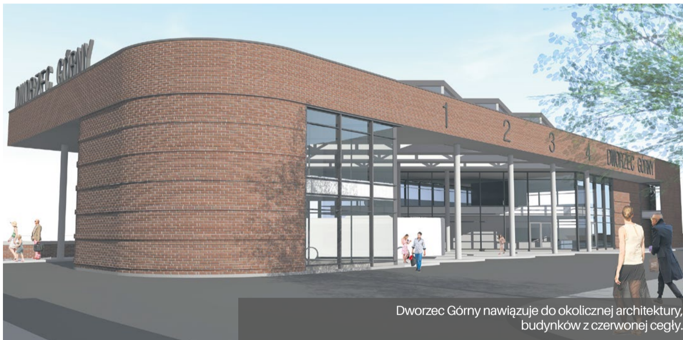
Dworzec Górny nawiązuje do okolicznej architektury, budynków z czerwonej cegły.