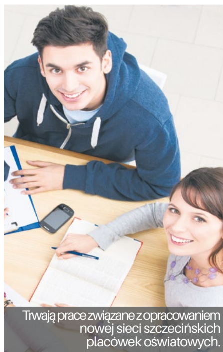
Trwają prace związane z opracowaniem nowej sieci szczyńskich placówek oświatowych.