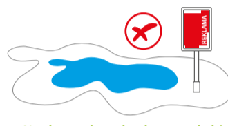
Na obszarach wodnych oraz na lądzie w odległości do 5 m od linii brzegu.

Uporządkowanie chaosu reklamowego w mieście to główny cel tzw. uchwały krajobrazowej miasta Szczecin. Zachęcamy do zapoznania się z najważniejszymi zasadami uchwały.