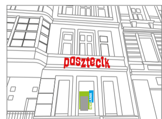
Szyldy i witryny

Stosowane formy tablic i urządzeń reklamowych