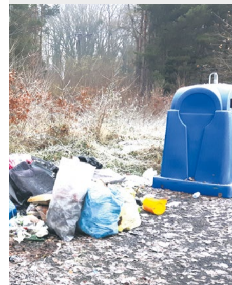
Ul. Ceramiczna - odpady komunalne przy pojemnikach na surowce wtórne