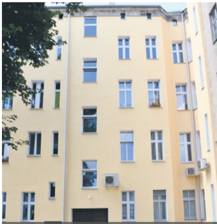
Kompleksowe remonty szczecińskich kamienic w ramach programu Kawka