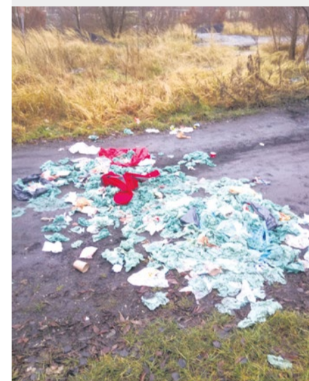
Garazowisko przy ul. Szafera - dzięki wysypisko śmieci.

Z nowej, ulepszonej wersji aplikacji Alert Szczecin 2.0 można korzystać w urządzeniu mobilnym (telefon, tablet) opartym na Androidzie, systemie iOS czy Windows Phone.