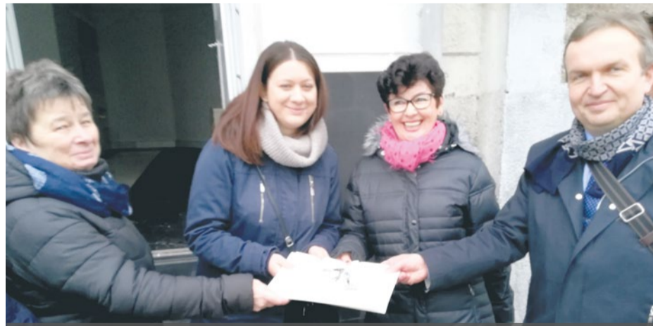
Lokal użytkowy przy ul. Żółkiewskiego 4, przekazany Jadłodzielni

Miasto Szczecin pozytywnie odpowiada na apel Jadłodzielni i przekazuje jej lokal użytkowy przy ul. Żółkiewskiego 4, stanowiący własność Szczecińskiego TBS, w którym może być prowadzona dalsza działalność.