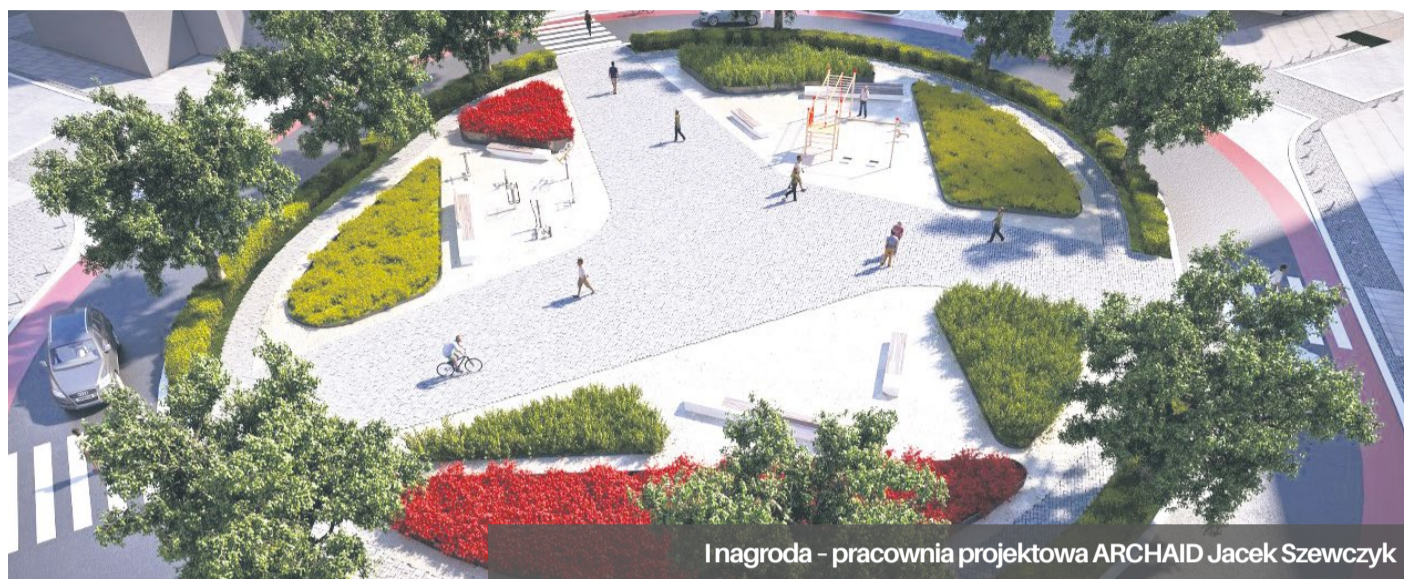
I nagroda - pracownia projektowa ARCHAID Jacek Szewczyk

Zwycięską wizję w konkursie architektonicznym na zagospodarowanie przestrzeni publicznych w obszarze alei Wojska Polskiego przedstawiła Pracownia Projektowa ARCHAID.