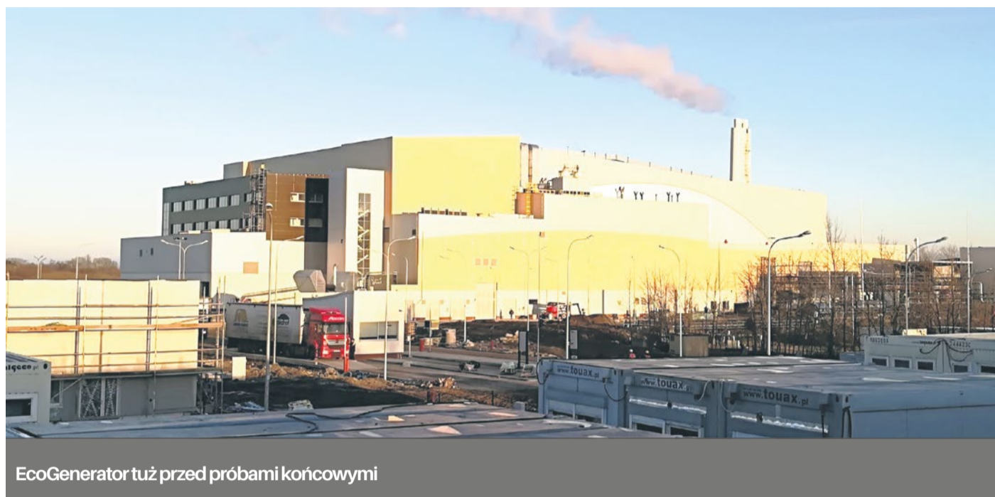
EcoGenerator tuż przed próbami końcowymi