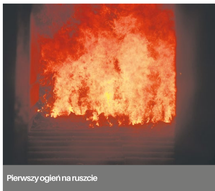
Pierwszy ogień na ruszcie