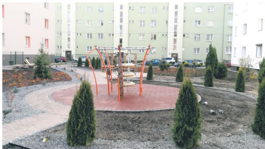
Efekty Programu już można podziwiać m. in. przy ul. Zakopiańskiej

Ponad 100 podwórek za 10 mln złotych - to wymierny efekt 10 lat realizacji programu „Zielone Podwórka Szczecina”. Program przypadł do gustu mieszkańcom, którzy coraz chętniej sięgają po pieniądze na metamorfozę swojego otoczenia. Kończy się kolejna edycja programu.