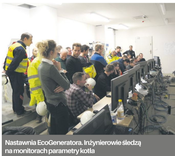
Nastawnia EcoGeneratora. Inżynierowie śledzą na monitorach parametry kotła

wowało parametry kotła i rusztu na monitorach w nastawni.