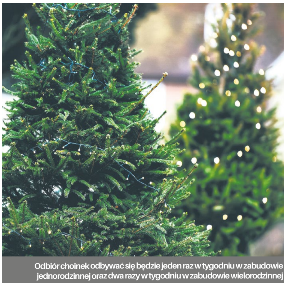
Odbiór choinek odbywać się będzie jeden raz w tygodniu w zabudowie jednorodzinnej oraz dwa razy w tygodniu w zabudowie wielorodzinnej

Przygotowane do odbioru choinki można też zgłaszać bezpośrednio do firm wywozowych.