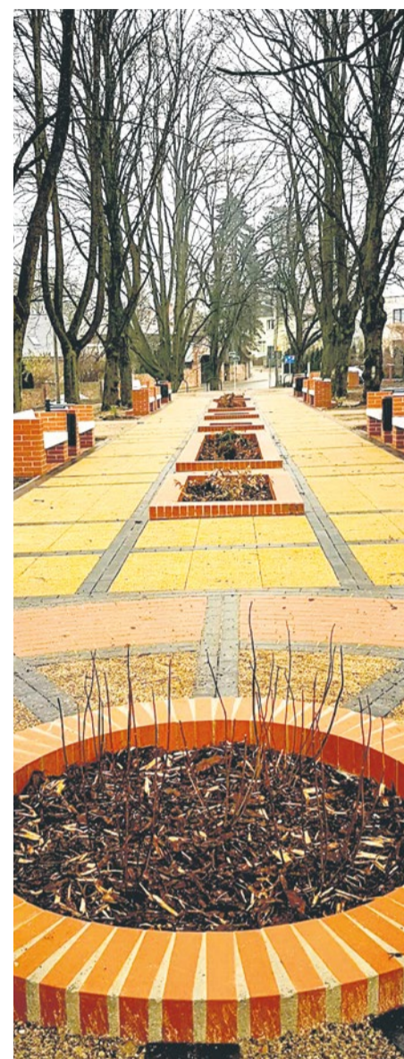
Klinkierowe alejki zakończone niewielkimi placami w Parku Lipy.

Zakończyła się przebudowa Parku Lipy. Mieszkańcy mogą korzystać z nowoczesnego miejsca pełnego atrakcji.