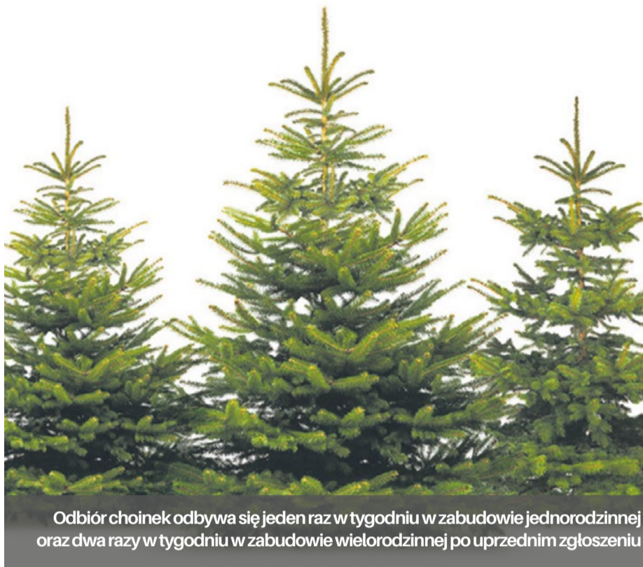
Odbiór choinek odbywa się jeden raz w tygodniu w zabudowie jednorodzinnej oraz dwa razy w tygodniu w zabudowie wielorodzinnej po uprzednim zgłoszeniu

Sektor IV wtorek jednorodzinna/wielorodzinna piątek wielorodzinna