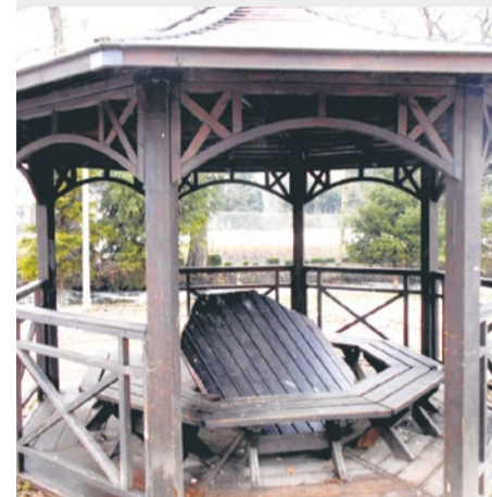
Uszkodzony stół w parku przy ul. Cichej.

Z nowej, ulepszonej wersji aplikacji Alert Szczecin 2.0 można korzystać w urządzeniu mobilnym (telefon, tablet) opartym na Androidzie, systemie iOS czy Windows Phone.