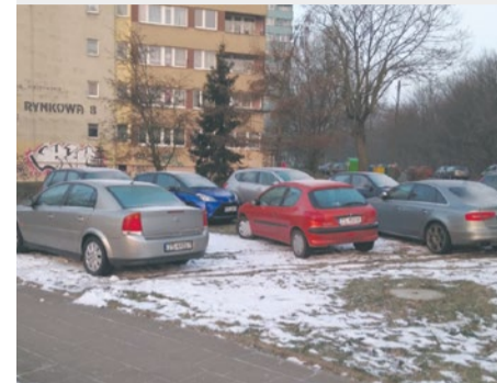
Rynkowa i Dembowskiego. Kierowcy notorycznie niszczą zieleń.