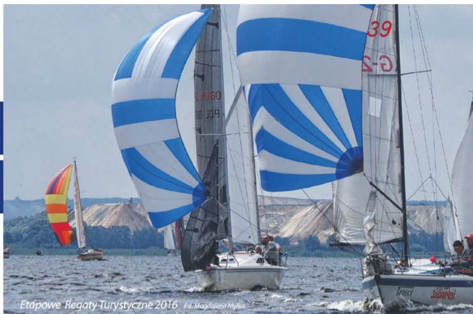
Etapowe Regaty Turystyczne 2016

Podczas drugiej edycji Międzynarodowych Nagród Żeglarskich Szczecina wyróżnione zostaną osoby, osiągnięcia i inicjatywy związane z żeglarstwem.