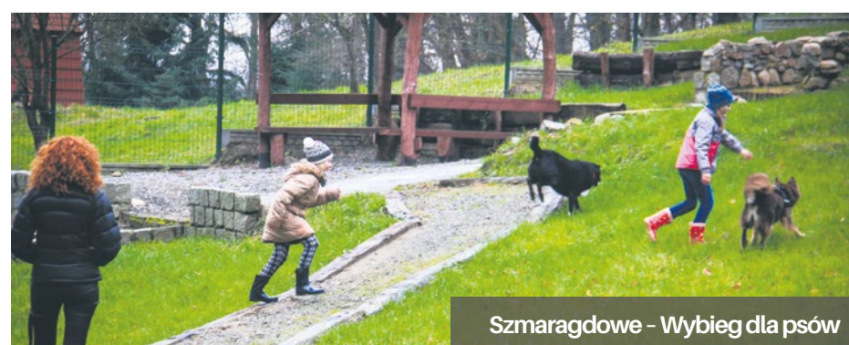
Szmaragdowe - Wybieg dla psów