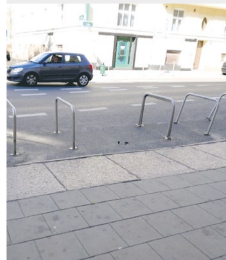
Ulica 5 Lipca. Zniszczone stojaki rowerowe.