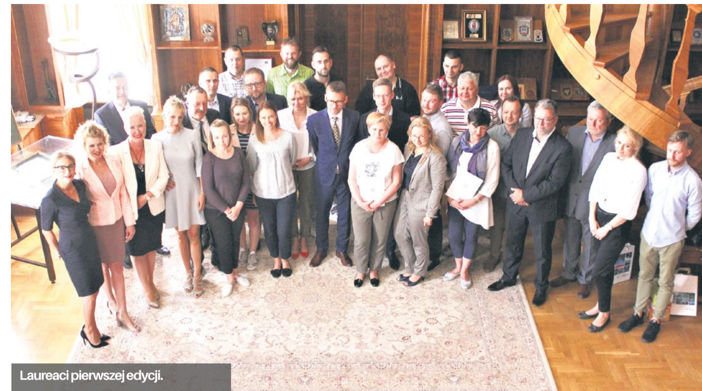
Laureaci pierwszej edycji.

Trwa nabór wniosków do drugiej edycji konkursu o przyznanie marki „Zrobione w Szczecinie”.