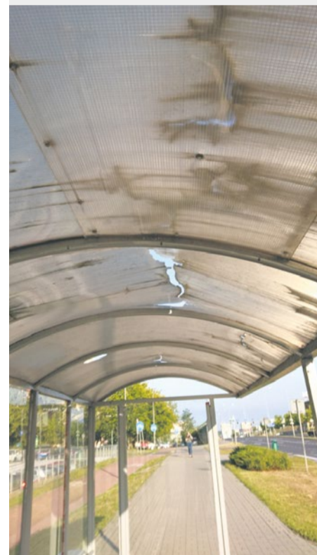
Ul. Przyjaciół Żołnierza. Dziurawy dach wiaty na przystanku.

Z nowej ulepszonej wersji aplikacji Alert Szczecin 2.0 można korzystać w urządzeniu mobilnym (telefon, tablet) opartym na Androidzie, systemie iOS czy Windows Phone.