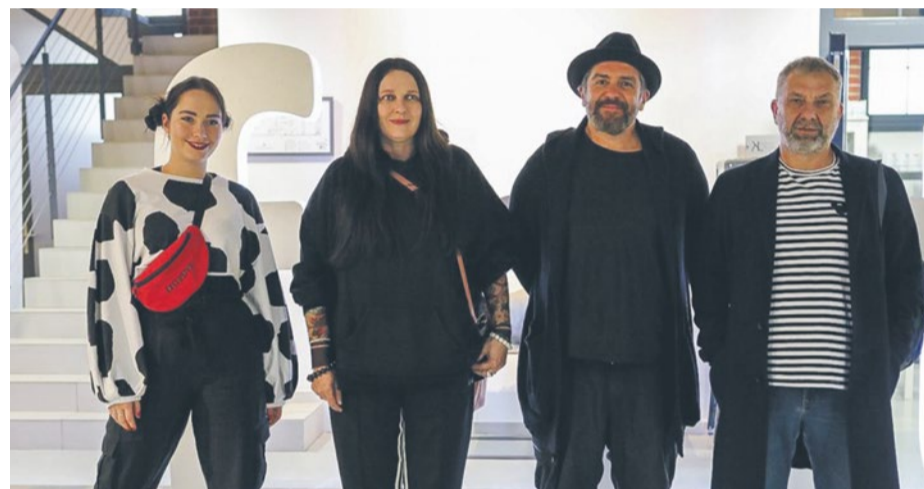
Jury Festiwalu Młodych Talentów

Po przesłuchaniu tej dziesiątki, wybrano finałową trójkę: PANIE z Łodzi , Wasabi z Tarnowa i Wołanie z Warszawy .