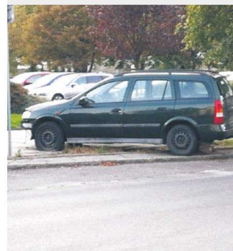
Wrak w centrum miasta