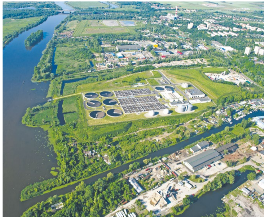
Dzięki oczyszczalni „Pomorzany” od ponad 10 lat ścieki nie trafiają już do Odry

W porównaniu z innymi oczyszczalniami z tej części Europy, „Pomorzany” to zakład technicznie i eksploatacyjnie bardzo zaawansowany. W wielu dziedzinach, jak chociażby w produkcji