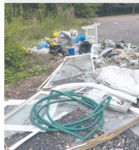
Ul. Ceramiczna – dzikie wysypisko, podzrut

Z nowej, ulepszonej wersji aplikacji Alert Szczecin 2.0 można korzystać w urządzeniu mobilnym (telefon, tablet) opartym na Androidzie, systemie iOS czy Windows Phone.