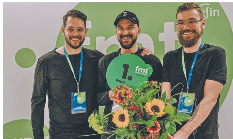
Zwycięski zespół PANIE

Partner festiwalu, wytwórnia muzyczna Kayax, od lat wspiera twórczość młodej sceny muzycznej, wyławiając w niej zdolnych i ambitnych twórców. Zwycięzcy ostatnich edycji FMT, zespoły Romantic Fellas, Blunt Razor i Hyper Son, uzyskały wsparcie producenckie i promocyjne, pozwalające za funkcjonować i stać się bardziej rozpoznawalnym na komercyjnym rynku. Służy temu m.in. projekt Kayaxu „My Name Is New”, którego zwycięzcy FMT z 2017 i 2018 r. stali się ambasadorami.