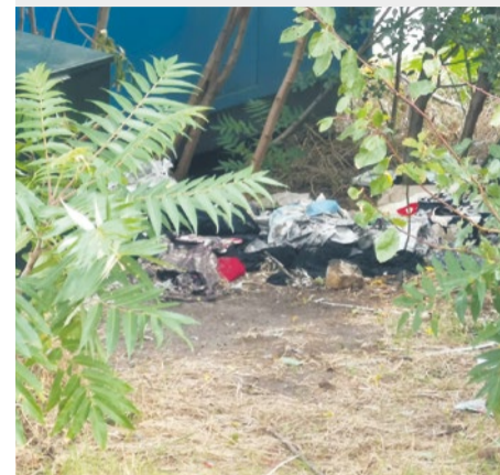
Ul. Milczańska – śmietnisko