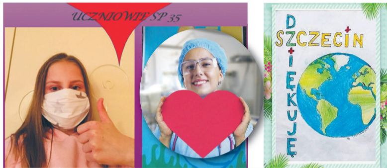
Uczniowie Szkoły Podstawowej nr 35 dziękują Medykom.

Od przyszłego tygodnia swoją działalność wznowią również kolejne żłobki publiczne: Żłobek nr 5 (ul. Kazimierza Królewicza 61) oraz Żłobek nr 9 (ul. Brytyjska 19). Dodatkowo, z opieki w placówce będą mogły skorzystać również dzieci uczęszczające do grup stworzonych w ramach Regionalnego Programu Operacyjnego Województwa Zachodniopomorskiego (Żłobek nr 2, Żłobek nr 3, Żłobek nr 5, Żłobek nr 6 oraz Żłobek nr 7).