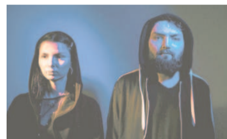
The Party Is Over