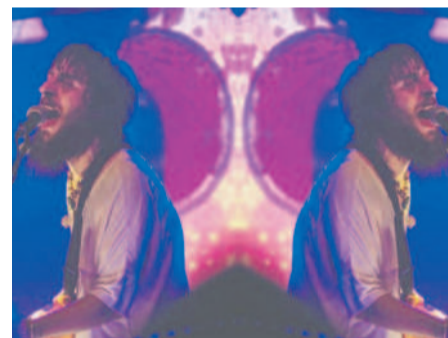
Gypsy and the Acid Queen