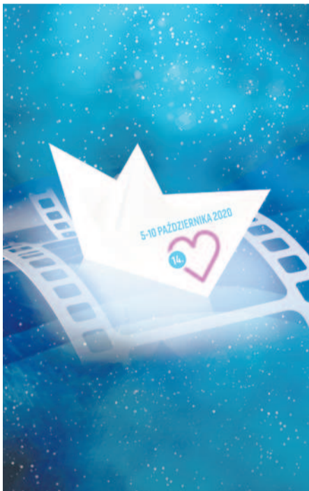
Dąbskie Wieczory Filmowe