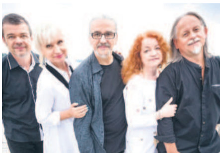
Zespół Czerwony Tulipan

Wystawa ukazuje sposoby, w jaki sztuka odbijała ekscytacje i lęki związane z przystąpieniem krajów byłego bloku wschodniego do Unii Europejskiej, oraz jak wyraża, negocjuje i poddaje krytyce ideę dążenia do zjednoczonej Europy. Wychodząc od społecznej atmosfery około roku 2004, zadaje